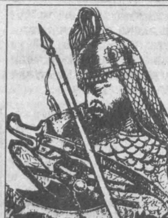
«АЛПОМИШ» ДОСТОНИНИНГ 1000 ЙИЛЛИГИ ОЛДИДАН