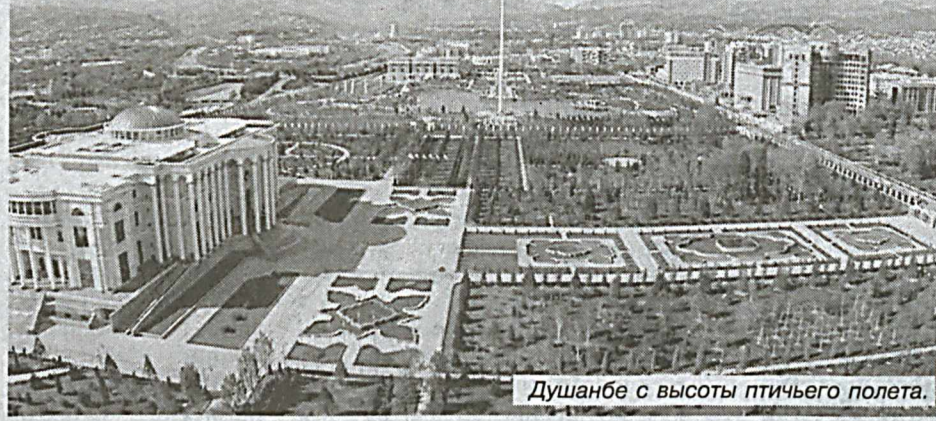
Душанбе с высоты птичьего полета.