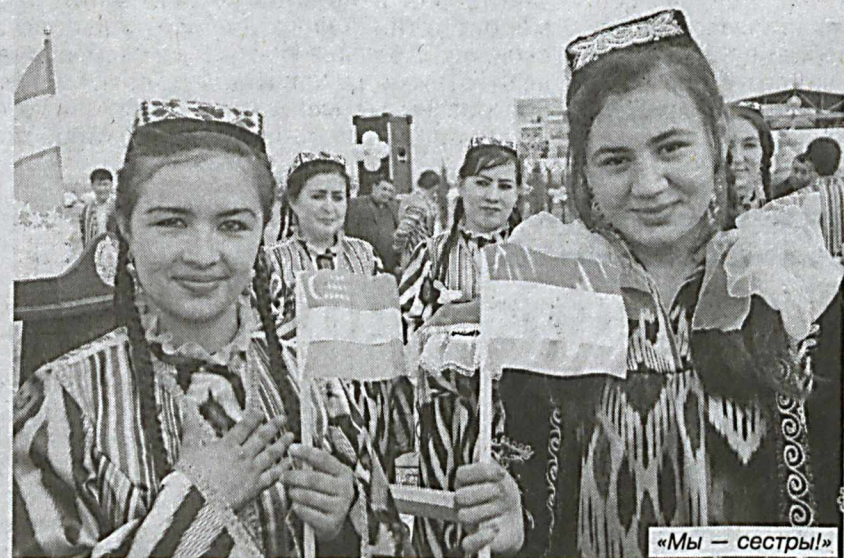
«Мы — сестры!»