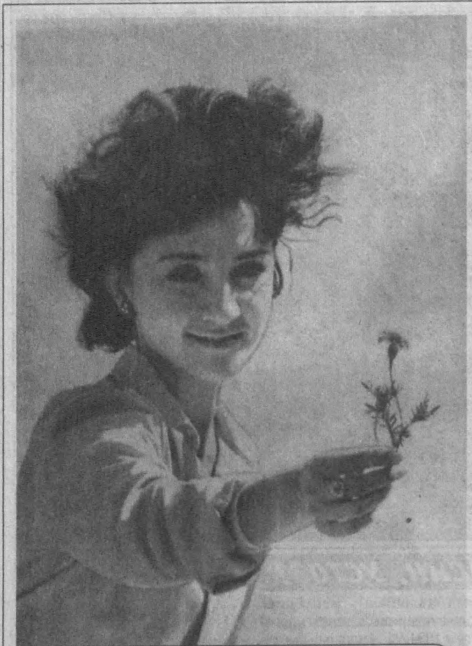
Баҳор гулдан сўйлайди, Олам ойдин-нурчечак. Рангин-рангин кўйлайди Қўлимдаги Гулчечак.