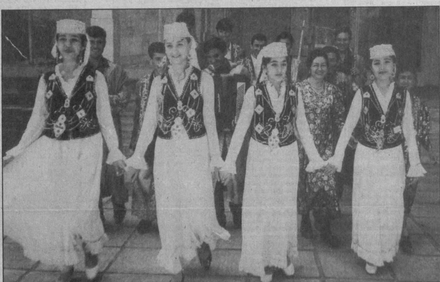
СУРАТДА: ашула ва рақс дастаси иштирокчилари.

Ўзбекистон Республикаси Олий ва ўрта махсус таълим вазирлиги, Республика истеъдодли ёшларни қўллаб-қувватлаш Улуғбек жамғармаси