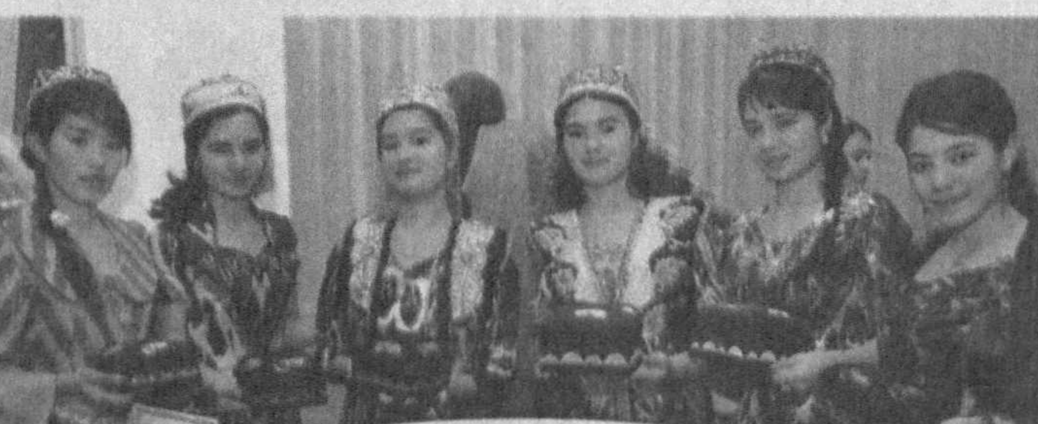
Ўзбекистон Хотин-қизлар кўмитаси ташаббуси билан "Дўппи тикдим ипаклари тиллодан..." деб номланган кўрик-танлов ўтказилди. Мазкур танловнинг якуний босқичи ҳамда миллий хунармандчилик буюмлари кўргазмаси пойтахтимиздаги 1-Тошкент педагогика коллежиде бўлиб ўтди.

Унда танловнинг Қорақалпоғистон Республикаси, вилоятлар ва Тошкент шаҳри босқичларида голиб деб топилган ёш хунармандлар ва уларнинг устозлари иштирок этдилар.