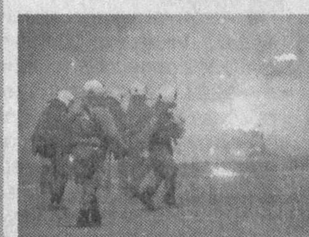
Тартибсизликларга 6 декабрь кунини полиция ходимининг эҳтиётсизлиги туфайли афиналик 15 ёшли ўғли Александрос Григорулолос...

"France Presse" ахборот агентлигининг маълум қилишича, Грециянинг бир қатор шаҳарларида ҳукуматга қарши норозилик намойишлари бўлиб ўтмоқда.