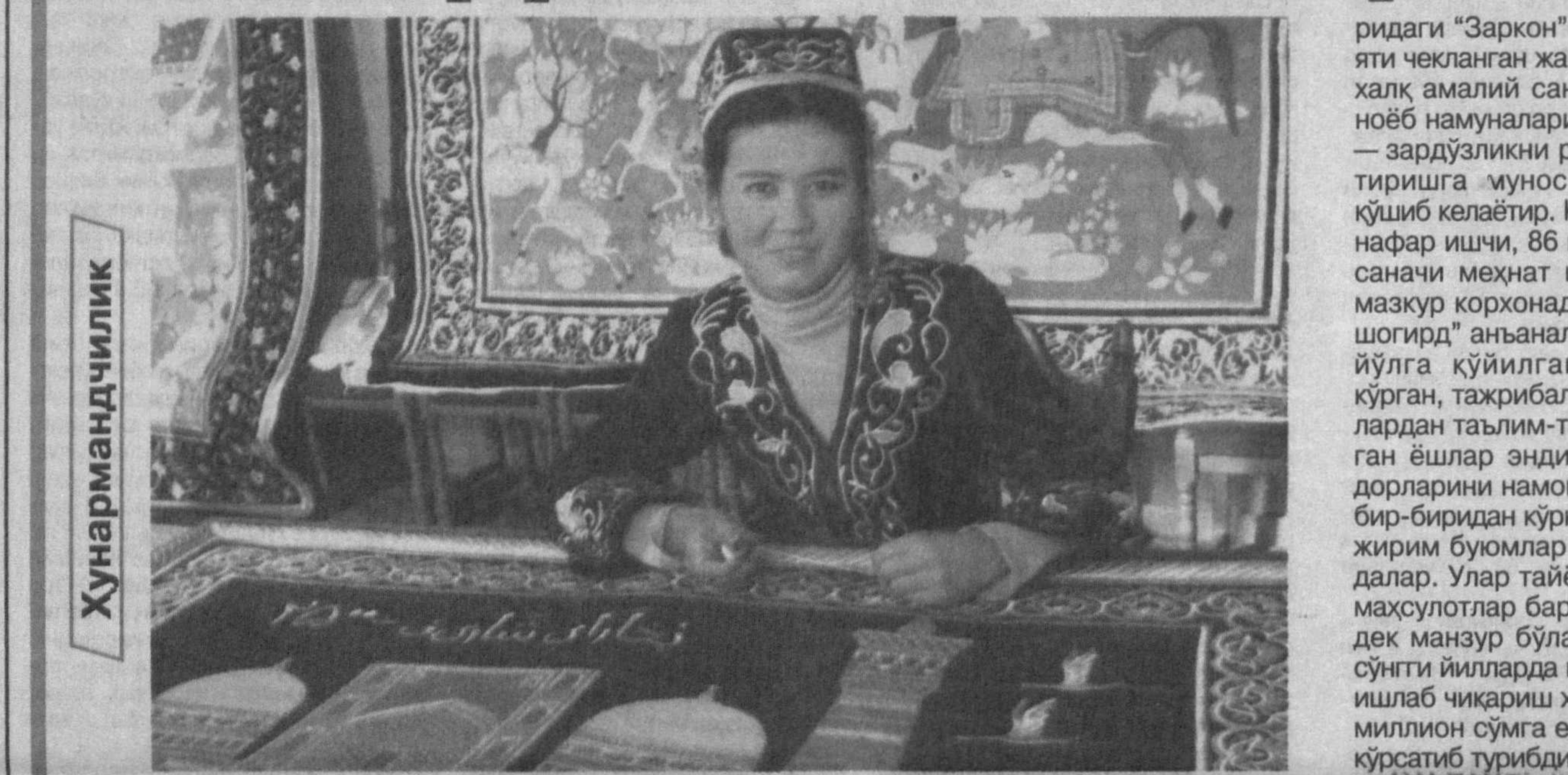
Мамлакатимизда Президентимиз раҳнамолигида ёш авлоднинг ҳар томонлама билим ва қонил инсон қилиб тарбиялашга устувор вазифалардан бири сифатида қаралмоқда.

Шундан келиб чиқиб аййтиш мумкинки, бу жа- раёнда уларни касб-хунарга, миллилатимизга хос аънава ва кадрятларни асраб-авайлашга ўргатиш ҳам муҳим аҳамиятга эгадир. Бугунги кунда Бухоро шаҳ-