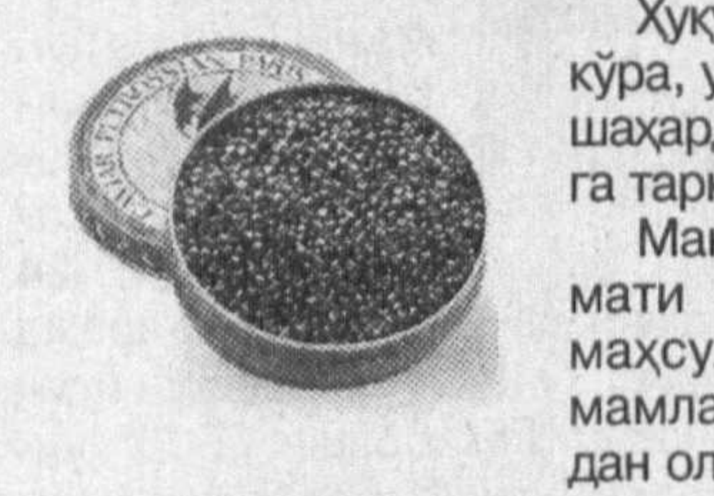
Хориж матбуоти хабарлари асосида тайёрланди.

Италия полицияси ўтган ойда Милан шаҳрига ноқонуний равишда олиб кирилган 40 килограмм қора икрани мусодара қилди.