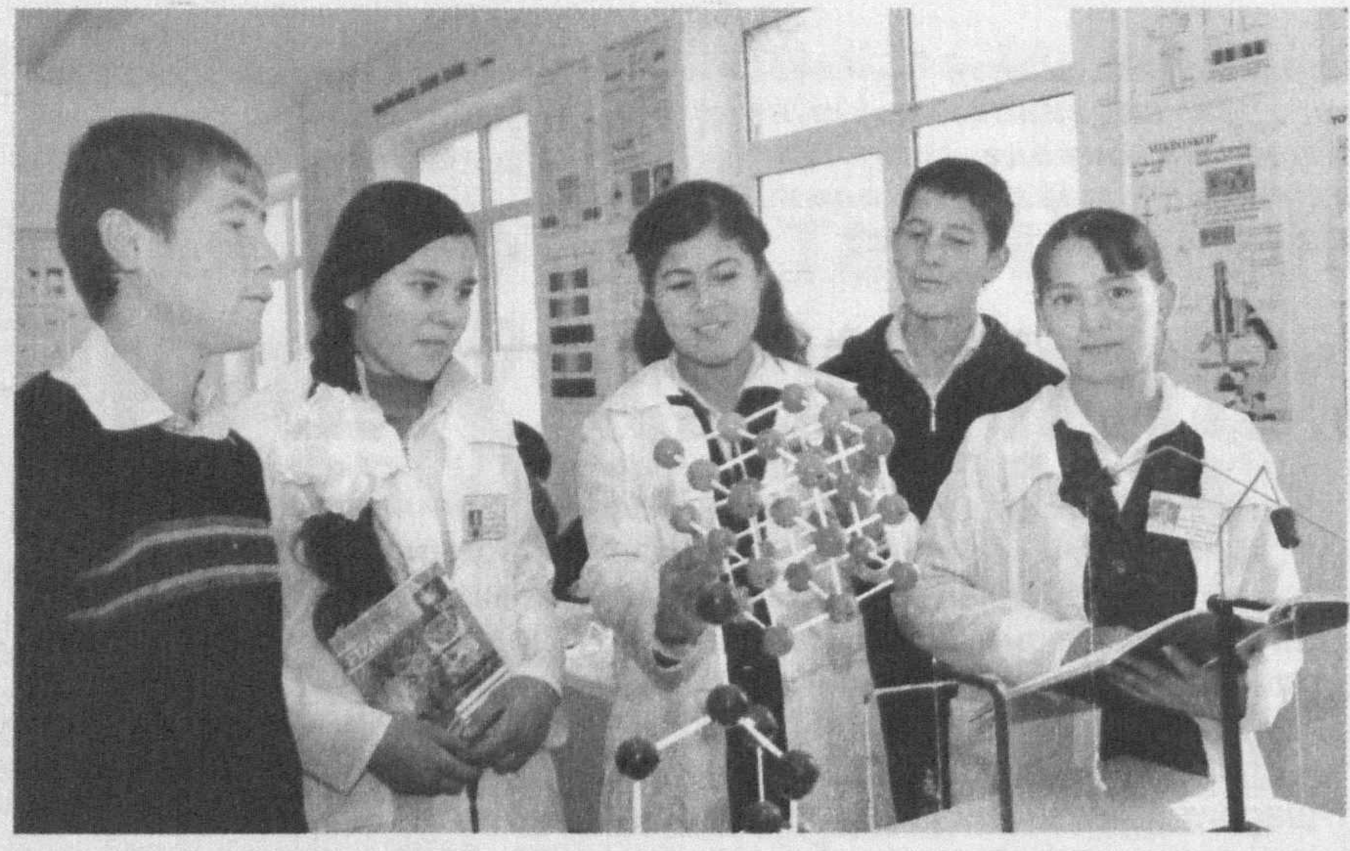
Мамлакатимизда истеъдодли йигит-қизларни қўллаб-қувватлаш, улар иқтидорини рўйбга чиқариш масаласига юксак эътибор қаратиб келинмоқда. Президентимизнинг бекиёс ғамхўрликлари боис, бугун минглаб ўзбек фарзандлари муҳташам таълим масканларида, хориждагидан асло қолишмайдиган олий ўқув юртиларида тахсил олмоқдалар.