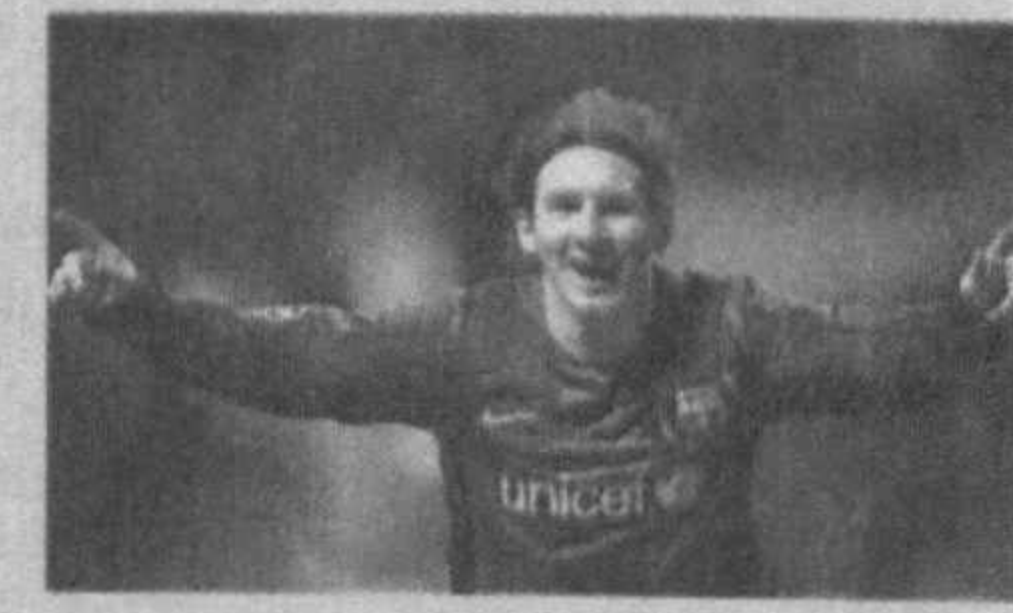
Лионел Месси Ташкентга таширф буюрди.

— Аввало, мени Ўзбекистонга таклиф этиб, шу қадар илиқ кутиб олишганидан гоят хурсандман, — деди Месси журналистлар билан мулоқотда. — Шунга ташкилдамочки эдимки, 2003 йилги ёшлар ўртасидаги жaxon чемпионати бахсларида айнан Ўзбекистон терма жамоасига қарши ўйнаганим хамон ёдимда. Ушунда Ўзбекистонлик футболчилар ўзларининг мазмунли ўйинлари билан бизда илиқ таассурот қолдиришган. Бугун мамлакатимизга келиб, футболга берилётган эътибор билан янгда акнрок танишдим. Насиб этса, ҳамкорлигимиз хали узоқ давом этади.