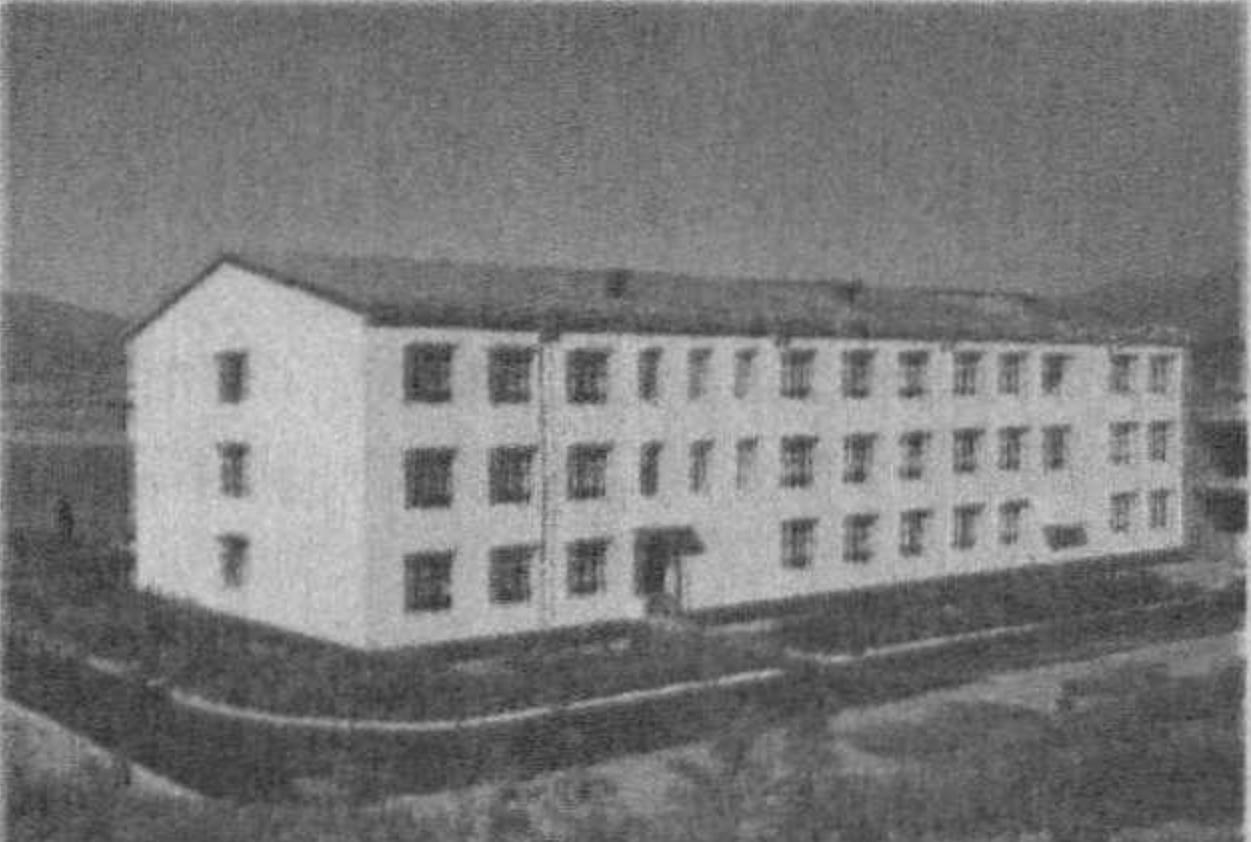
(Давоми. Боши 1-бетда).

Ташкент давлат юридик институтини жамоаси «Жиноят процесси» кафедраси катта ўқитувчиси Давлатбек Ҳабибуллаева синглиси Чароҳсон ҲАБИБУЛЛАЕВнинг вафоти муносабати билан чўқур таъзия изҳор этди.