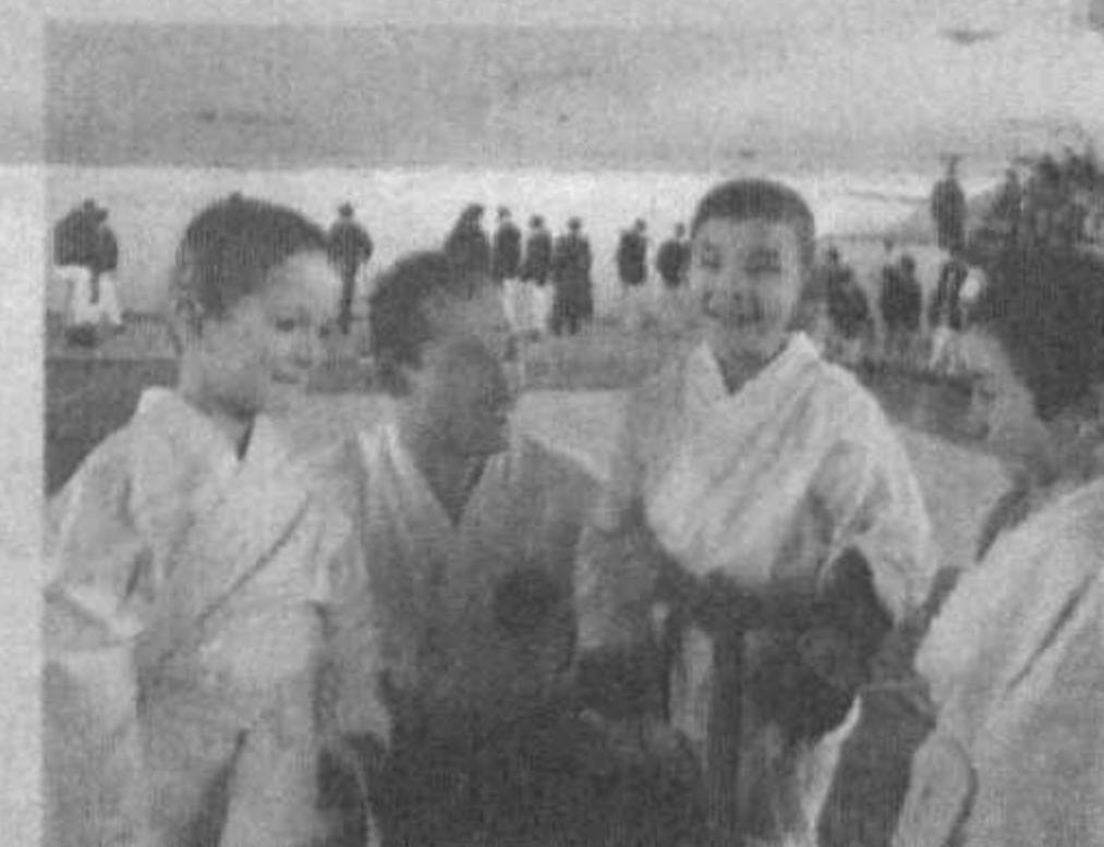
Энди голиблар орасидан халқаро мусобақаларда юртимиз шарафини химоя қиладиган терма жамоа шакллантирилади.

Яқунда умумжамоа ҳисобида Ташкент вилояти қарат-дочилари шохсупанинг юқори погонасидан жой олишди. Буюро вилояти вакиллари иккинчи, Ташкент шаҳри жамоаси эса учинчи ўринни эгаллади. Шунингдек, Самарқанд, Сурхондарё, Қашқадарё ва Навоий вилоятлари қарат-дочилари қўлга киритган медаллар ҳам салмоқли бўлди.