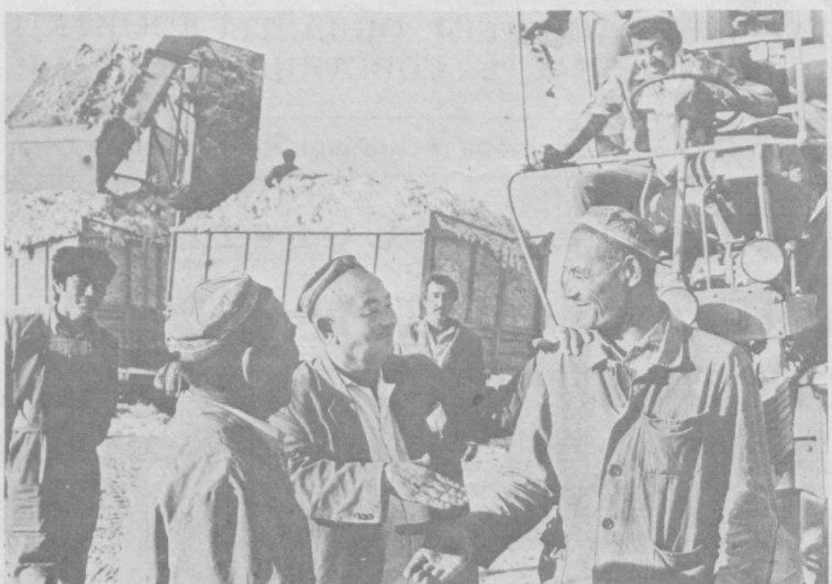
ВОТИНЦЕВ НОМЛИ КОЛХОЗ ДАЛАЛАРИДА