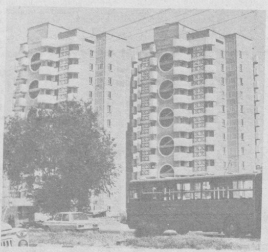
БУГУНГИ ТОШКЕНТ. Суратда: Ҳамза районининг Ғалаба массивида қурилган янги қўн қаватли уй-жой бинолари.

часи орқали юрадиган бўлганда бундан манзилга етиб олишга қўнчилигимиз. Талабимиз — «Бошлиқ» массивини Эскишаҳар билан Богдан Хмельницкий кўчаси орқали боғлайдиган янги маршрут очилса ёки 32-автотўсишни яна эски йўлга қайтарилса. У. МАҲМУДОВА.