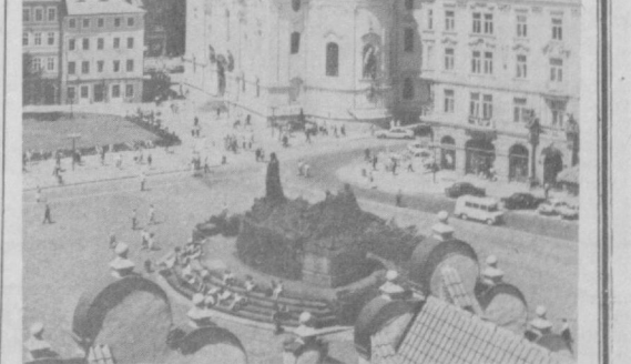
Прагадаги кўҳна Старомест майдони — кўпгина тарихий воқеалар гувоҳиди. Унинг марказида ҳаёслон халқи овозидан ҳаракатланган Ян Густа хайроми доҳийси Ян Густа хайроми доҳийси Ян Густа хайроми доҳийси...

Депутатларга тўртала номзоднинг исми шарифлари ёзилган рўйхат берилди ва ҳар бир депутат ўша рўйхатда фақат бир номзодни қўлириб қолганларини ўчириши лозим. Шундай йўсида, энг