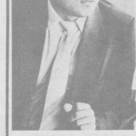
ИШ ҲУҚУҚЛИК ҚАЙТИШДИ

Миллий ўз-ўзини аниқлаш жараёни тил билан боғлиқ жуда кўп муаммоларни юзга чиқарди. КПССнинг ҳаракат дастурида партия миллий маданиятларининг ўзинга хос