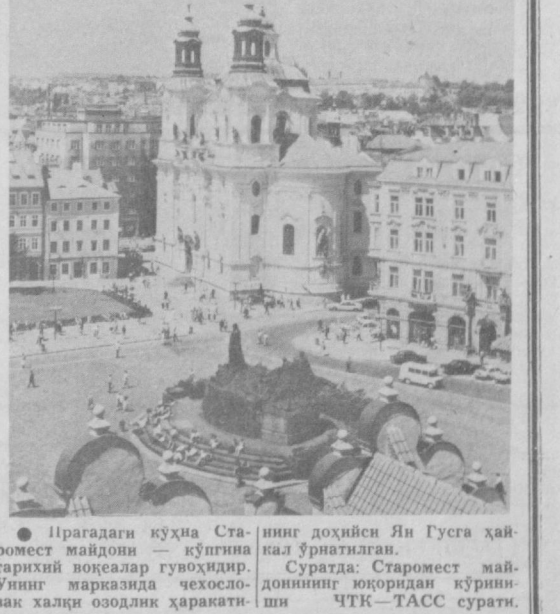
Прагадаги кўҳна Старомест майдони — кўпгина тарихий воқеалар гувоҳиди. Унинг марказида ҳаёслон халқи овозидан ҳаракатланган Ян Густа хайроми доҳийси Ян Густа хайроми доҳийси...

бермоқда. Қатнашчиларнинг кўпчилиги бир неча телеви-зион ташкилотлардан вақил бўлиб келишган. Улар ораси-да СССР, АҚШ, Буюк Бри-танния, Греция, ГФР бор.