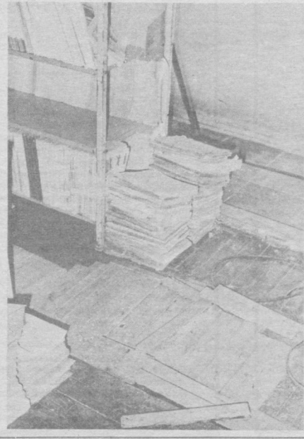
✦ СУРАТЛАРДА: зах хоналардаги китобларнинг бундай аянчли аҳволига ким ачинамайди дейсиз? Энди улардан ҳеч ким наф кўролмаслиги турган гап-ку!

Бошқарма Кенгашининг қарори билан Ангрен, Янгиўл, Бекобод, Оҳангарон савдо бўлиминининг савдо бўйича директор ўринбосарлари жиддий огоҳлантирилган.