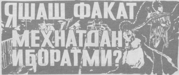
ҚИШЛОҚ АЁЛЛАРИНИНГ ТУРМУШ МАДАНИЯТИ ЭЪТИБОРДАН ЧЕТДА ҚОЛМОҚДА

оляпмиз. Фермадада дам олиш хонаси, турли йиғилишлар учун зал, душхона бор. Керак бўлса дам олиш уйлари, санаторийларга йўланма-лар оламиз. Хуллас, бир сўз билан айтганда ишларимиз яхши. — Сиз ўзингиз бирор марта дам олиш уйига бордингизми! — сўрайман суҳбатдошимдан. — Йўқ, менинг иложим йўқ, Оила, болалар. — Дам олиш хонасида телевизор кўриб, радио тинглайсизларми! Еки газета-журналлар ўқийсизларми! — Вақтимиз йўқ. Ҳа, ҳамма гап мана шу вақтнинг йўқлигида. Ҳар бирларида 4—5 нафардан фарзанд бўлган бу аёллар ҳеч қачон бу ерда дам олиб ўти-