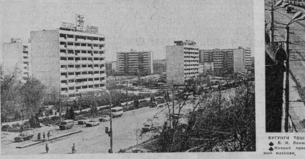
Бугунги Тошкент. В. И. Ленин проспектининг йўлининг. Наъвий проспекти, Пойтхотимизнинг Киров районидagi янги турар жон массиви.

КПСС Марказий Комитетининг 1 Май Чидириқларидан руҳланган 159-трестга қарашли 13-қурилиш бошқармасининг Тўққизинчи беш йилликдаги меҳнати учун коммунистик меҳнат бригадаси коллективи шарафига «Марказ-27» квартални қуришида зарбдор меҳнат қилмоқда.