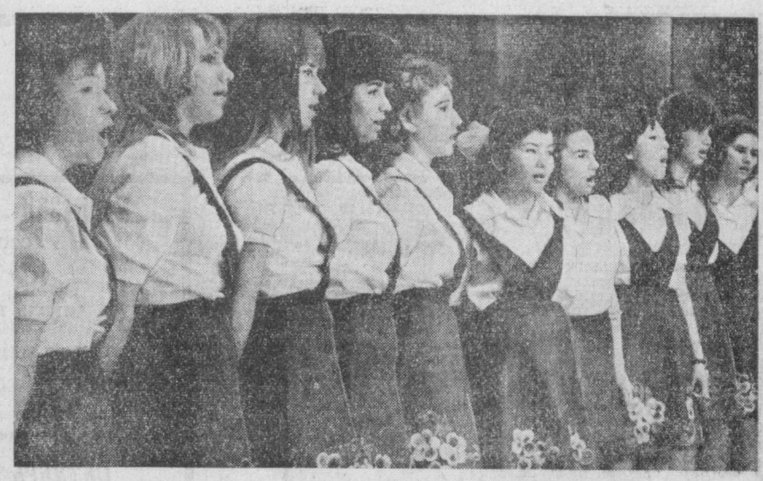
Шахримиздаги Глиэр номи маданият уйи кеч қурунлари айниқса гаваж бўлади. Ешлар ўқиш-дан ва ишдан бўш вақтларида бу ерга нелиб, ўзлари севаган санъат ва хунар сирларини ўргана-дилар. Санъат ишчибозлари учун эса эстрада, ашула ва раис ансамбллари ишлаб турибди. Сиз суратда кўриб турган бу қизлар А. Бутузоза раҳбарлик қилётган ашула ансамблида шугу-ланишади. Уларнинг репертуарида рус халқ ва замонавий эстрада кўшиқлари бор.

мамлакат яхши кўши-чилигининг сарчамала-рини таҳлил этар эки-миз, бугунги кишилар-ни тўқинлантираётган проблемалар тўғрисида ўйлади. Бу кино-фильм Хельсинкида бў-либ ўтган тарихий ке-нгаш тўғрисидаги хуж-жатли мадрлар билан яқунлади. Биз бунда ўтмиш билан бугунги кунини туташтирувчи кўприк кўйгандек бў-ди. Фильмда Владимир Ильич Ленин образини СССР халқ артисти Ки-рилла Лавров яратган. (ТАСС).