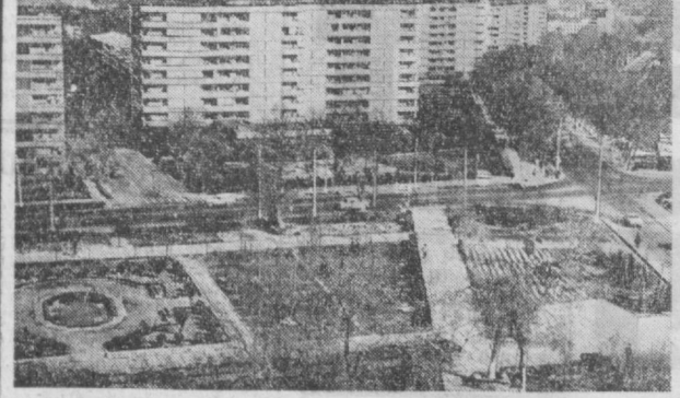
БУГУНГИ ТОШКЕНТ. «Украина» кварталнинг В. И. Ленин хиёбонидан кўриниши.