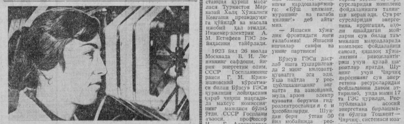
Республикамиздаги шўй.и.п.п.к.га баъзилари тўқин корхоналарига юқори сифатли хом ашёни бераётган пойтахт таъбирлаи пилла-нашлик фабрикаси коллектининг асосий қисмини ҳунар-техника билим юртлари ва ўрта мактабларни таъминлаб келган ишлар ташкил этидилар. Сиз журналда газетхон манз бу фотоларда ана шундай беш ишчилардан бири моҳир урочи, илгор комсомол-ишлар бригадаси аъзоси, Марғуба Шодмонбековани қуриб турибсиз.

Унчи беш йиллик топшириқларини мудатидан илгари бажариш учун бошланган мусобақада илгор терувиқлардан Йўлдош Шабиллар, Пулчибой Қаримов, Дурадгор Бахтиёр Иноятов, пайнақчилардан Владислав Ромушнинг азаматлар қўлиб қилишлти. Уларнинг номини фонд қат бошқармадаги азамат, трестда ҳам ҳурмат билан тилга олишди.