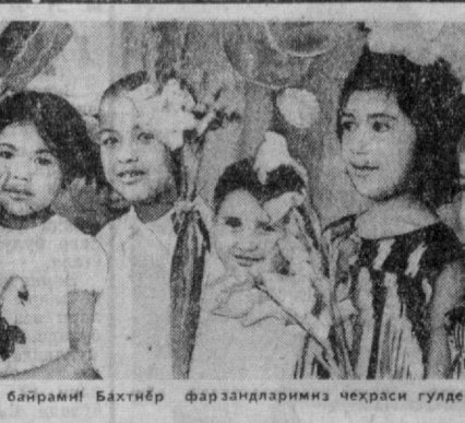
«Тинчлик, бахт, баҳор байрами! Бахтиёр фарзандларимиз чеҳраси гулдек яшнган».

Осиё, Африка ва Латин Америка мамлакатларининг IV халқаро кинофестивали ташкилий комитетининг адресига ана шу анжуманда иштирок этишни истаган мамлакатлардан мактублар келиб турибди.