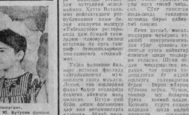
«Тинчлик, бахт, баҳор байрами! Бахтиёр фарзандларимиз чеҳраси гулдек яшнган».

Осиё, Африка ва Латин Америка мамлакатларининг IV халқаро кинофестивали ташкилий комитетининг адресига ана шу анжуманда иштирок этишни истаган мамлакатлардан мактублар келиб турибди.