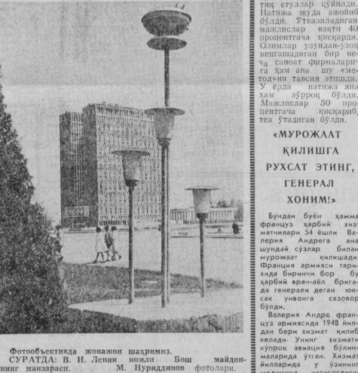
Фотообъективда жонажон шахримиз. СУРАТДА: В. И. Ленин номи Бош майдонининг манзараси.

Агар ит ва мушуклар ётиб қўйилиб, назорат қилиб турилмаса, бўйинбоқ ва турмушқанда бўлишига қарамай ўз эгаларисиз кўча ва майдонларда, парк ва ҳибонларда, ҳовли