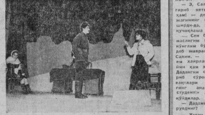
СУРАТДА: спектаклдан кўриниш.