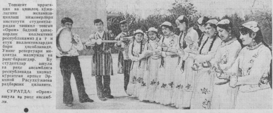
СУРАТДА: «Ором» ашула ва рақс ансамбли.

Шодинада ҳаммаси бўлиб маҳалланинг 47 ҳурматли кишига янги нуздаги паспортлар топширилади. К. ҲАМРОЕВ, В. ЛАПИНА.