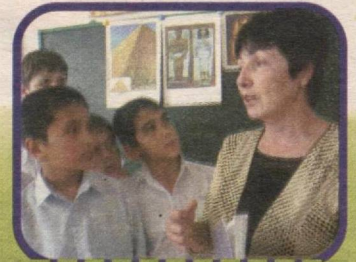
6-«V» sinfida tarix darsi.