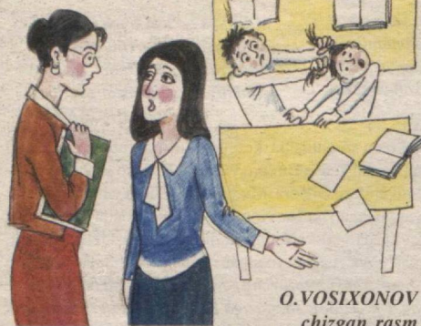
O.VOSIXONOV chizgan rasm