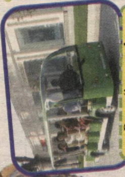
Bu mo'jaz avtoulav yo'lovchilar uzog'ini yaqin qilmoqda.

Har safar Samarqandga tashrif buyurganimizda, shahardagi yangidan yangi o'zgarishlar hayratimizni oshiradi. Bu gal ham Samarqandning yangi, keng va ravon Toshkent ko'chasidan borar ekanmiz, chiroyli, hashamatli do'konlarni ko'rib, o'zimizni Yevropa shaharlarida yurgandek his qildik. Bu ko'chadagi ajoyib bir avtoulav e'tiborimizni tortdi. Avtoulav Registon maydonidan Toshkent ko'chasi bo'ylab harakatlanib, yo'lovchilar uzog'ini yaqin qilar ekan. Do'konlardagi zardo'zli kiyimlar-u hunarmandlar yasagan haykalchalarga mahliyo bo'yli, 21-maktabga borib qolganimizni ham sezmay qolibmiz.