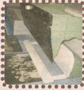
«Maktab tarixi muzeyi»dan joy olgan ekspozitsiyalar.