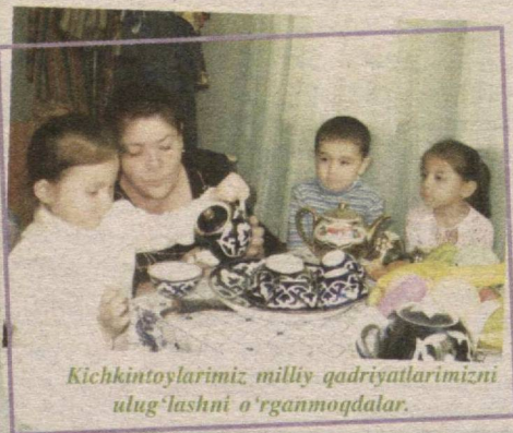
Kichintoylarimiz milliy qadriyatlarimizni ulug'lashni o'rganmoqdalar.