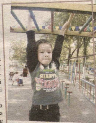
Sportning qadrin bilib, Chiniqaman mashq qilib.

Quvnoqlar koshonasidagi shodlik bir onda bizni baxtivor bolalikka, betakror go'zallikka oshno etdi. Bu yerdagi yashnab turgan tabiatning o'zi bir mo'jiza. Hattoki, hovlidagi qiyy'os ochilib turgan gullarda, ertak qahramonlarining haykallarida, sport maydonchalarida - bar-