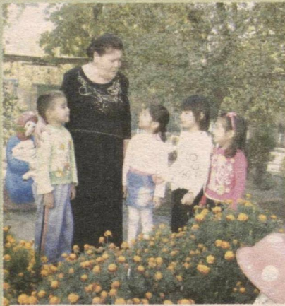
Bog'bondan parvarish ko'rmasa nihol, Ulg'ayib o'solmas, topolmas kamol!

Bolajonlar, hayotni sevishni uchta shirin mevasi bor ekan. Ular tan salomatligi, ko'ngil rohati-yu, zehning ortishi. Bu uchta shirin meva, albatta, bolalikdan shakllanadi. Bu borada, ayniqsa, maktabgacha ta'lim muassasalarining o'rni beqiyos.