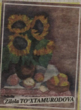
voyaga yetayotganiga biz ham amin bo'ldik.

To'garak a'zolarining ijodiy ishlarini ko'zdan kechirar ekanmiz, bu dargohda ko'plab iste'dodlar