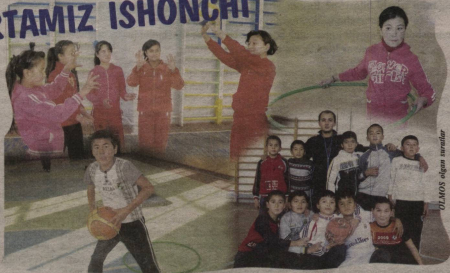
OLMOS olgan suratlar

2014-yilda 115 ta sport obyekti va 48 ta bolalar musiqa va san'at maktablarini qurish hamda rekonstruksiya qilish, ularni zarur anjom va uskunalar bilan ta'minlash rejalashtirildi.