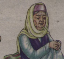
This is an old woman She is a retired