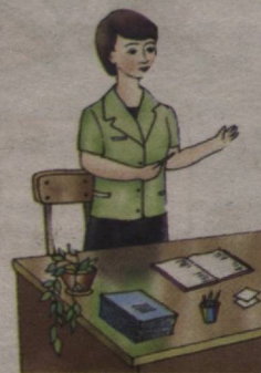
This is a woman She is a teacher