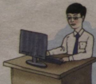
This is a boy He is a student