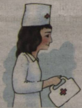
This is a woman She is a doctor