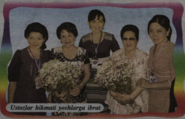
Ustozlar hikmati yoshlarga ibrat

Anjumana doirasida «Ommaviy axborot vositalari va yoshlar» mavzusidagi ijtimoiy