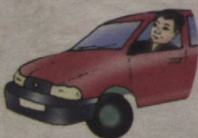
This is a man He is a driver