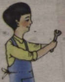
This is a man He is a worker