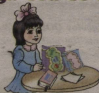
This is a girl She is a pupil