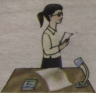
This is a woman She is an engineer