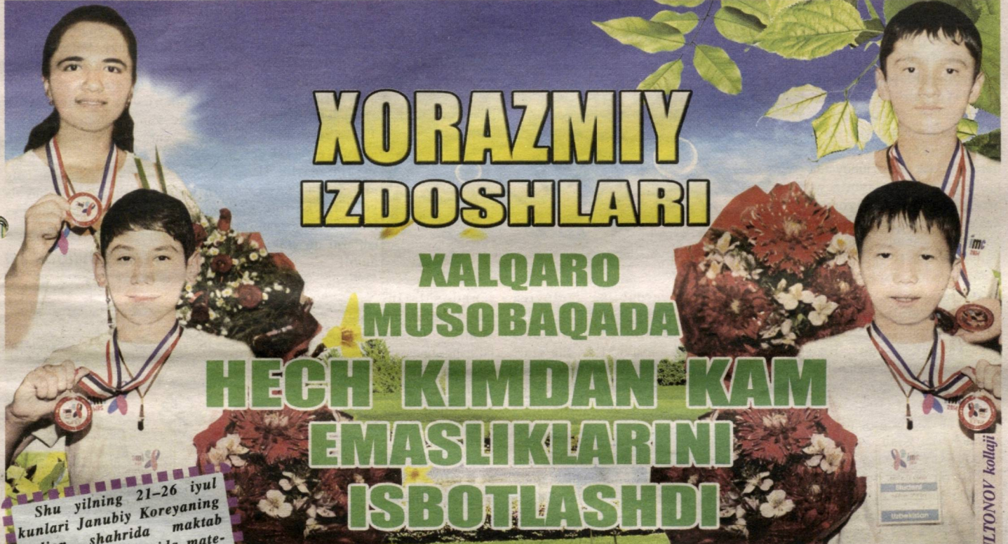
N. SULTONOV kollaji

HECH KIMDAN KAM EMASLIKLARINI ISBOTLASHDI