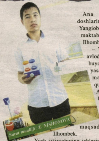
Surat muallifi: Z. NISHONOVA Ilhombek.

Bolajonlar, yozgi ta'tilda maroqli va mazmunli dam olayotgan bo'lsangiz kerak-a?! Bo'sh vaqtdan unumli foydalanib, biror-bir hunar o'rganayotganlar ham orangizda bisyor.