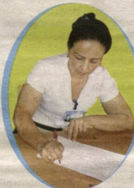
ZUBAYDA olgan suratlar

Fursatdan foydalanib, ushbu nashrning jajji muxlislarini, respublikamiz ustoz-murabbiylarini qo'shaloq bayram – Mustaqilligimizning 23 yilligi hamda yangi o'quv yili bilan chin qalbidan tabriklayman.