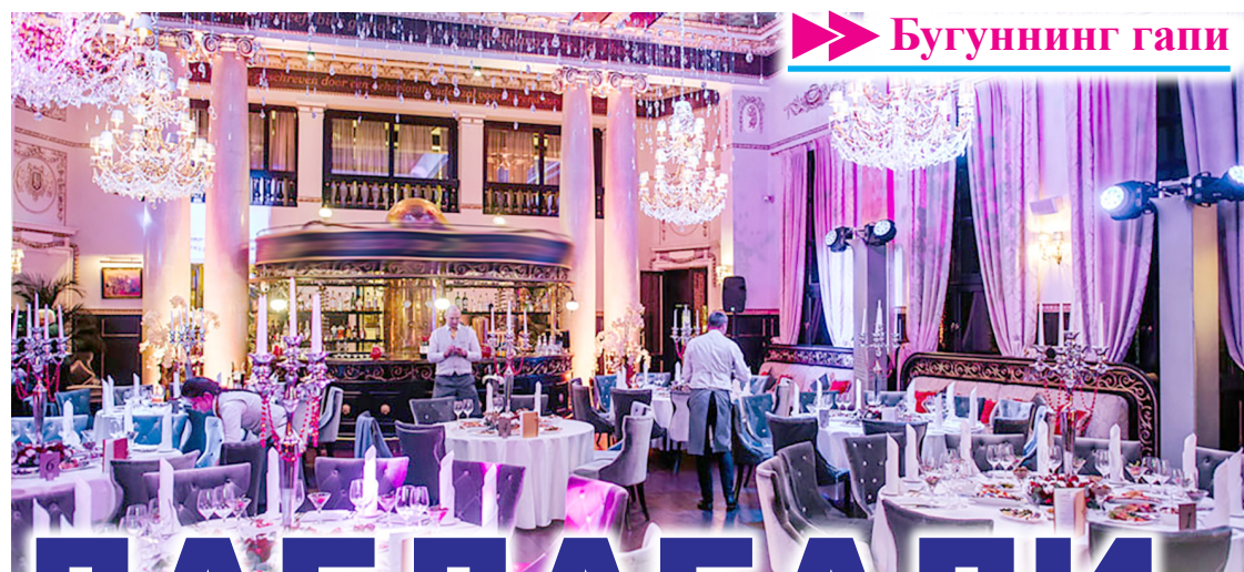
➔ Бугуннинг гапи