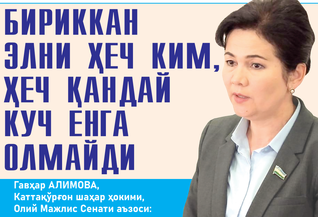
Гавҳар АЛИМОВА, Каттақўрғон шаҳар ҳокими, Олий Мажлис Сенати аъзоси:

Учрашув давомида маҳалла аҳолиси лойиҳа юзасидан ўз фикр ва таклифларини билдирди.