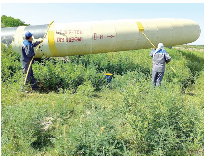
Ҳимоя майдони қувур ўқининг ҳар томонидан 25 метр масофада ўтадиган шартли чиқизқар билан чегарланади;

Муҳофаза ҳудуди: - қувур трассаси бўйлаб хавфсизлик ер участкаси кўринишида, қувур ўқининг ҳар томонидан 50 метргача масофада шартли чиқизқар билан чегараланган бўлади; - қишлоқ хўжалигига тааллуқли ерлардан