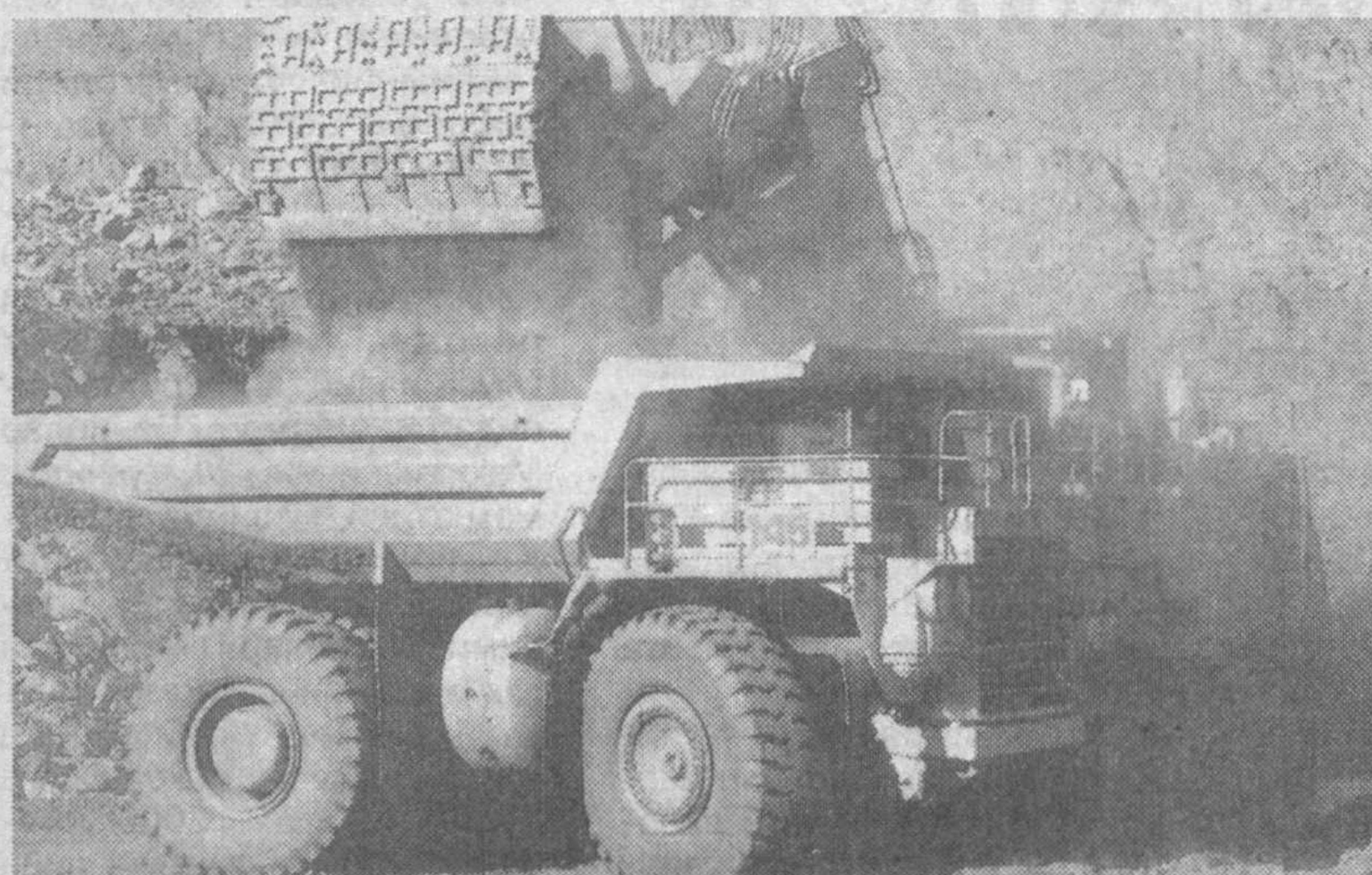
Навоий тоғ-металлургия комбинати: