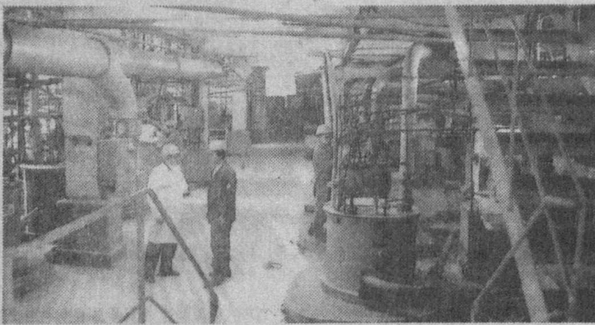
(Давоми. Боши 1-бетда).

2004 йилга келиб эса, ҳукуматимиз кимё заводларининг фосфорит ҳомиёсига бўлган талабларини тўлароқ қондириш мақсадида Қизилқум фосфорит мажмуини янада ривожлантириш тўғрисида қарор қабул қилди. Мазкур қарорга мувофиқ, 2006 йилда ана шу мажмуада белгиланган қувватга тўлиқ эришилади.