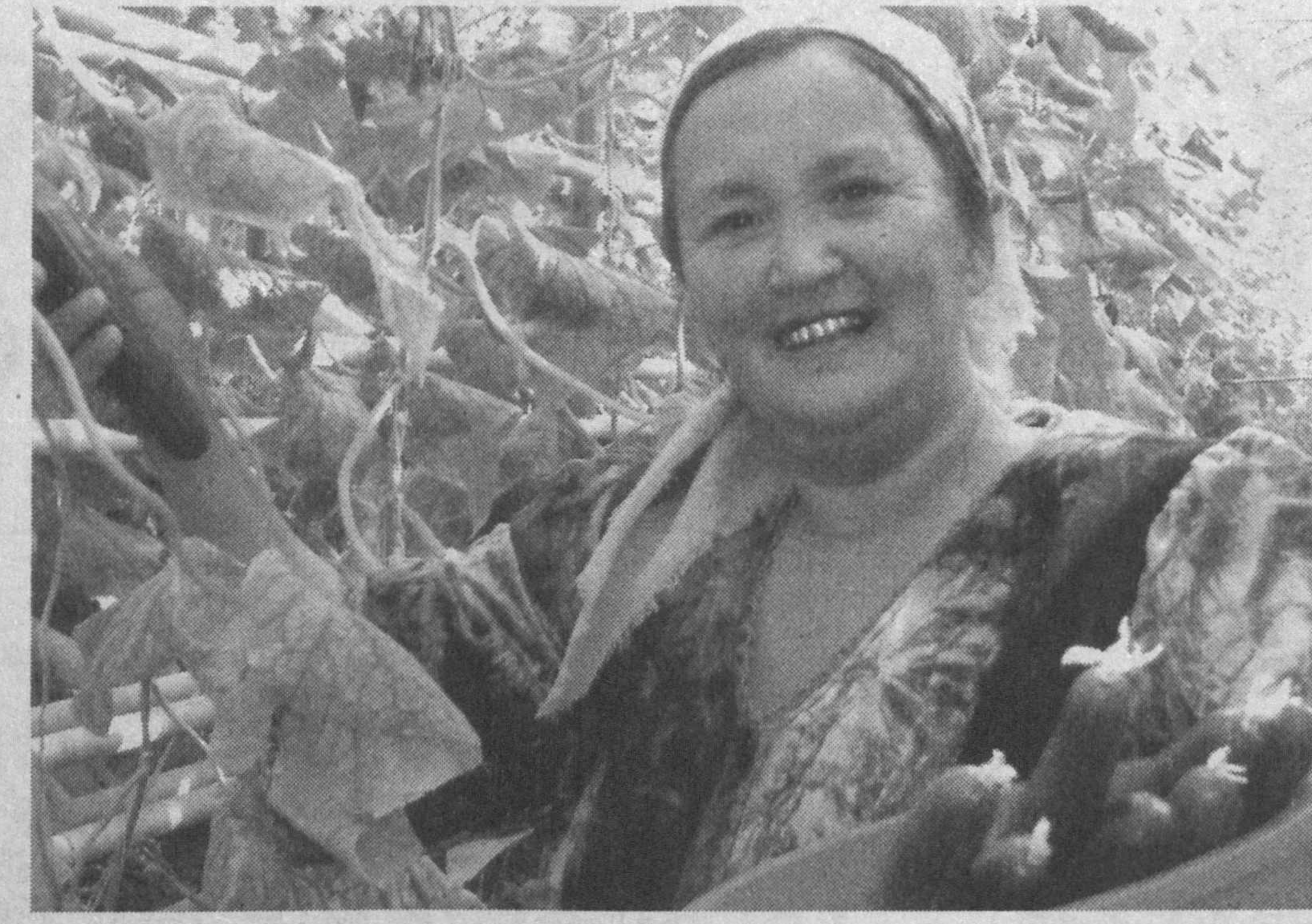
Нукус туманидаги «Қорақалпоғистон» маъсуляти чекланган иссиқхона хўжалигида етиштирилаётган бодринглар аҳолига манзур бўлаёттир. Жамоанинг аҳиллиги, тиришқоқлиги бу ерда ишининг бир маромада бажарилишини таъминламоқда. Айниқса, Исроил технологияси асосида иш юритиш айна мудоаа бўлди. Жамоа айна кунгача 165 тонна бодринг етиштириб, 50 миллион сўмга яқин даромад олди.

Халқимизда «Дардинг бўлса бўлсин, қарзинг бўлмасин» деган нақл бор. Биринчи навбатда хўжаликни қарз ботқоғидан чиқариш керак эди. Янги раҳбар атрофдагилар билан бамаблашқат иш юритди. Биринчи гагда мавжуд техника воситаларини таъмирлашга киришилди. Кейин 8 километр узунликдаги Хитойёп канални кенгайтирилди. Ерларнинг