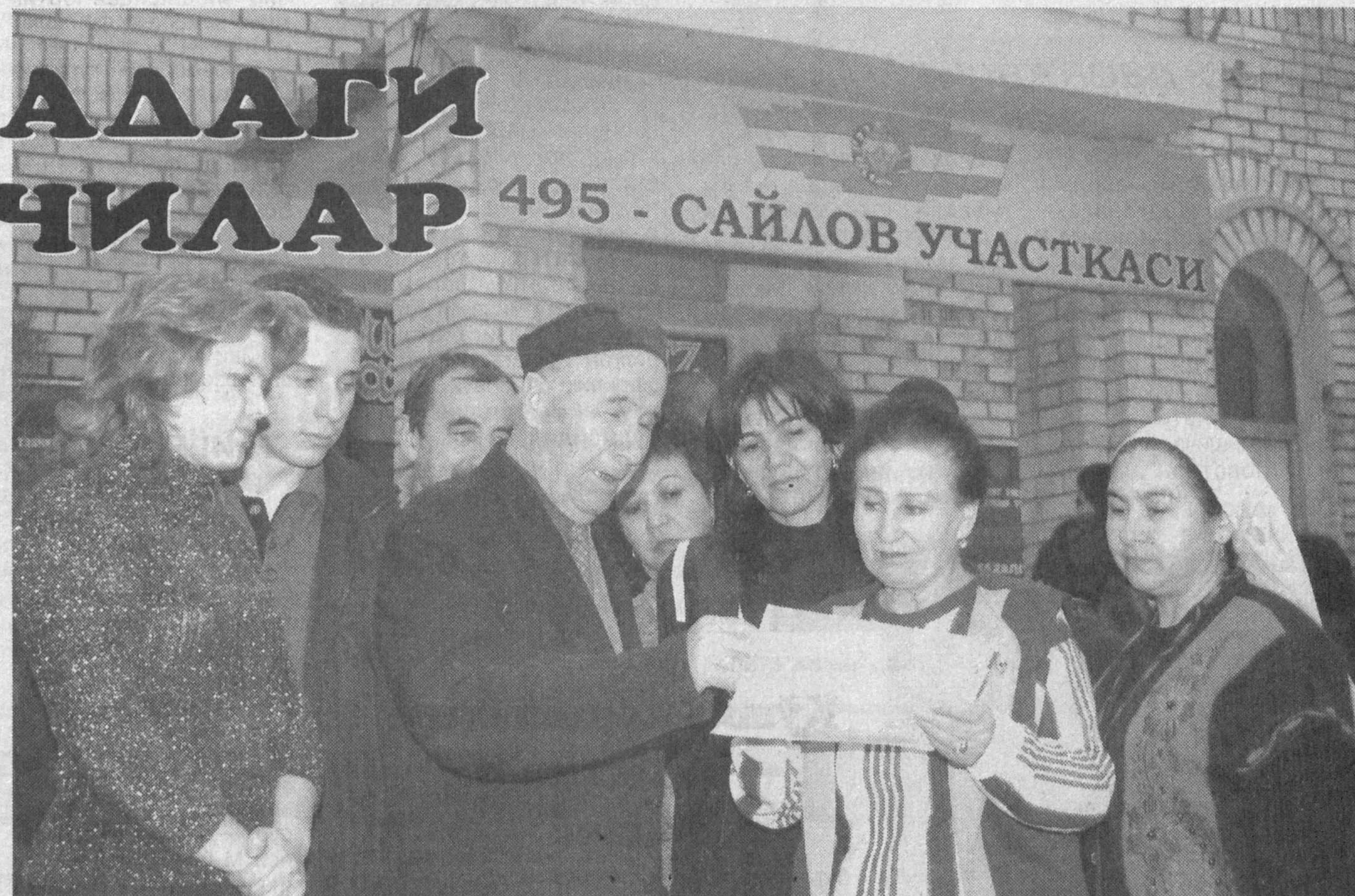
495 - САЙЛОВ УЧАСТКАСИ

Ўз ҳақ-ҳуқуқларини англаб етатган фуқароларнинг турли сиёсий тадбирларда фаол иштирокини кузатиб, юртимизда демократиянинг ривожланиб бораётганидан кўнглимиз кўтарилди. Табиийки, фуқаро ўз-ўзини бошқаришни ўрганса, жамиятда тенглик, адолатлик вужудга келади. Фуқаролик жамиятининг асосий белгиси ҳам ана шунда. Яъни, давлатнинг вазифа ваколатларини жамоат ташкилотларига босқичма-босқич ўтказиш орқали фуқароларнинг ижтимоий фаоллигини, сиёсий маданиятини оширишдан иборатдир. Маҳалла эса ана шу тамойилларга риоя этган ҳолда фуқароларга кўмак беради. Биз ана шундай маҳаллалардан бирида бўлиб, бунга яна бир қарра амин бўлдик.