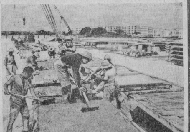
Ҳар йили минглаб кубалик оғиқлар янги, шинам уйларга кучиб ўт-моқдалар. Бу уйлари корхона ва ташиқотларнинг ички ва хизматчи-ларидан тузилган «микробригадалар» деб номланган ноилентилар бўлиб этмоқдалар. «Микробригадалар» янги уй-жой комплекслари ҳамда Куба учун зарур бўлган бошқа объектлар қурилишини тезлашти-ришда ёрдам кўрсатиб, катта ҳайрли иш қилмоқдалар. СУРАТДА: «микробригада» уй-жой комплекси қурилишида.

ПРАГА. Шимолий Чехиянинг Усти-Лабе шаҳридаги кemasozлик корхонасида Совет Иттифоқи учун муъ-жалланган эллигини сузувчи насос станция-си суғга туширилди. Насос бир секундада 7,5 куб метр сув чи-қариш қувватига эга. Прага, Мельник, Усти-Лабедаги кemasoz-лик корхоналарида ку-рилатган узибор ас-мадорлар ва сузувчи насос станция-лари «Чекос-Подсип-це» кemasozлик ишлаб чиқариш бирлашмаси-нинг маъсулотларидир. Бу маъсулотлар Совет Иттифоқида гоат ма-нороз бўлмоқда. Чехос-ловакиялик кemasoz-лар бу йил Совет Иттифоқи буюртма-ларини билан ҳамкор-ликнинг 25 йиллигини байрам қилдилар. Шу йиллар мобайнида Усти-Лабеда СССРга 282 та техникавий ке-ма етказиб берилди. 1976—1980 йилларда Совет Иттифоқининг буюртмалари асосида яна 74 та техникавий кема қурилади. БЕРЛИН. Магдебургда «Вема» ста-новозлик заводининг ходимлари Совет Итти-фоқи буюртмачилари учун электромоторларга узеллар ва деталлар ишлаб чиқаруви яна иккита комплекс по-ток линия қурдилар. Сўнгги икки йил мо-билидаги Совет Иттифоқида ГДРдаги ана шу корхонанинг фирма белгиси бўлган 22 та поток линия жу-зилади. БУДАПЕШТ. Венг-риянинг Мако шахри машинасозлари кўк ну-ҳат йиғиштириш учун муъжалланган серум машиналарини даст-лабки туркузининг Со-вет Иттифоқида ишлаб чиқариш бўлиб, энг янги ускуналар билан ижролангандир. Бу — ана шу кemasoz-лик корхонасида СССР учун қурилади-ган шу туркумдаги бешта кемаинг бирин-чиси.