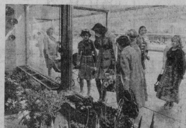
Дўстларнинг мамлакатни — Германия Демократик Республикасида. СУРАТДА: дрезденликлар чинакам гул ишчибозлари.

Пойтахт шаҳар партия комитети Ўзбекистон Компартияси Марказий Комитетининг Бош секретари ўртоқ Л. И. Брежневнинг Лихачёв номидаги автомобил заводида сузлаган кўнани қизини маъқуллаб, янгиўлликларнинг ташаббусига биринчилар қатори қўшилди.