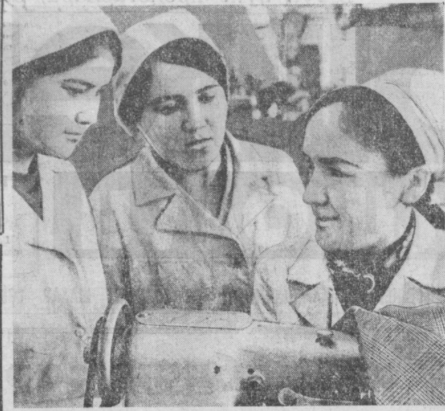
ПАРТИЯ ТУРМУШИ: ИДЕОЛОГИЯ ВА ҲАЁТ

Россия Федерациясининг қора тупроқли бўлмаган зонадаги ерларини ўзлаштириш учун Тошкентдан қилинган комсомолларнинг тағин бир отряди қўнаб кетди. Бу отрядда 150 йигит-қиз бўлиб, улар Ўзбекистондаги барча областларнинг вакиллари. Бу йигит-қизлар «Узновгород» трестидан мелиоратив ишларда, уй-жойларини, маданий-маиший объектларини, чорвачилик комплексларини барпо этишда меҳнат қиладилар.