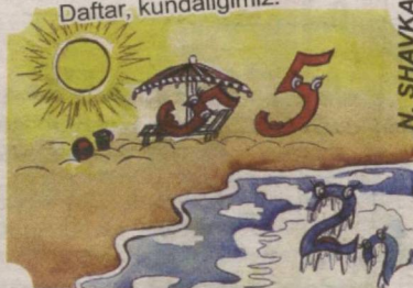
N. SHAVKATOVA chizgan rasmlar

Shundanmi, biz bolalar, «5» tomon intilamiz. «5» bahoga to'ladir, Daftar, kundaligimiz.