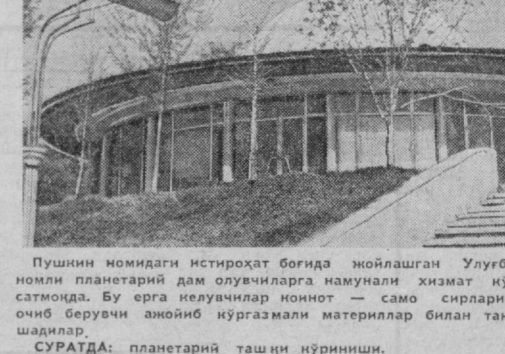
Пушкин номидаги истироҳат боғида жойлашган Улугбек номи планетарий дам олувчиларга намунали хизмат кўрсатмоқда. Бу ерга келувчилар ноинот — само сирларини очиб берувчи ажойиб кўргазмалар билан танишадилар.