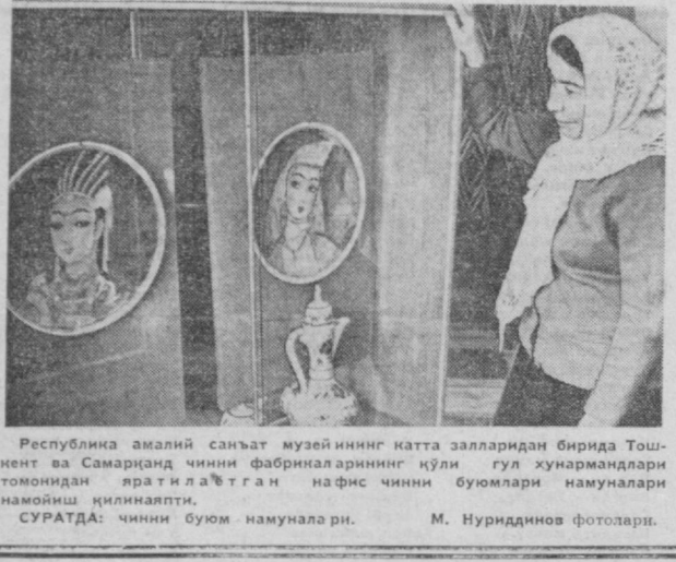
Республика амалий санъат музейининг катта залларидан бирида Тошкент ва Самарқанд чинни фабрикаларининг қўли гул хунармандлари томонидан яратилган нафис чинни буюмлари намуналари...