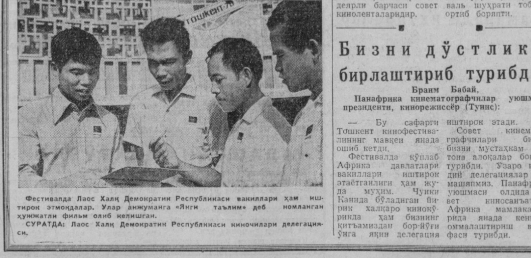
Фестивалда Лас Халқ Демократик Республикаси вакиллари ҳам иштирок этмоқдалар. Улар анжуманга «Янги таълим» деб номланган хужжатли фильм олиб келишган. СУРАТДА: Лас Халқ Демократик Республикаси киночилари делегацияси.

БУГУН Осиё, Африка ва Латин Америкаси мамлакатлари IV халқаро Тошкент кинофестивали иштирокчилари шаҳримиздаги бир қанча корхоналарда бўлиб, бу корхоналарнинг фаолияти билан танишдилар. Ишчи-хизматчилар билан суҳбатда бўлдилар. Санъат саройининг катта залида Вьетнамнинг «Икки она», Бразилиянинг «Эр-хотинлар» фильмлари намойиш этилди. Ки-чик залда эса йилгиланлар Марказий Африка Республикаси, Мавритания, Покистоннинг хужжатли ленталарини томоша қилдилар. Кечқурунги расмий намойишда Қозғистон ССРнинг «Ўз юлдузининг асра», Тунсининг «Эччилар» фильмлари кўрсатилди. Мароқаш, Куба, Покистон, РСФСРда ишланган хужжатли ленталар ҳам томошабинлар эътиборига ҳавола этилди.