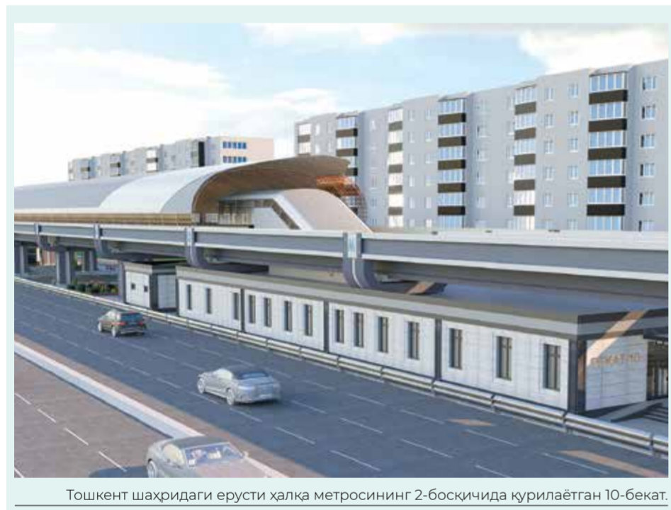
Тошкент шаҳридаги ерусти халқа метросининг 2-босқичида қурилаётган 10-бекат.

Дарҳақиқат, шу муқаддас заминни асраб-авайлаш, меҳнаткаш халқимизнинг орзу-умидларини рўйга чиқариш, юртимизни дунёнинг тараққий этган давлатлари қаторига олиб чиқишдек шарафли ишда Бекзод каби шижоатли ёшларга бугун катта ишонч билдирилмоқда. Ўйлаيمизки, улар бу ишонч ва масъулиятли вазифани шараф билан удалашади.