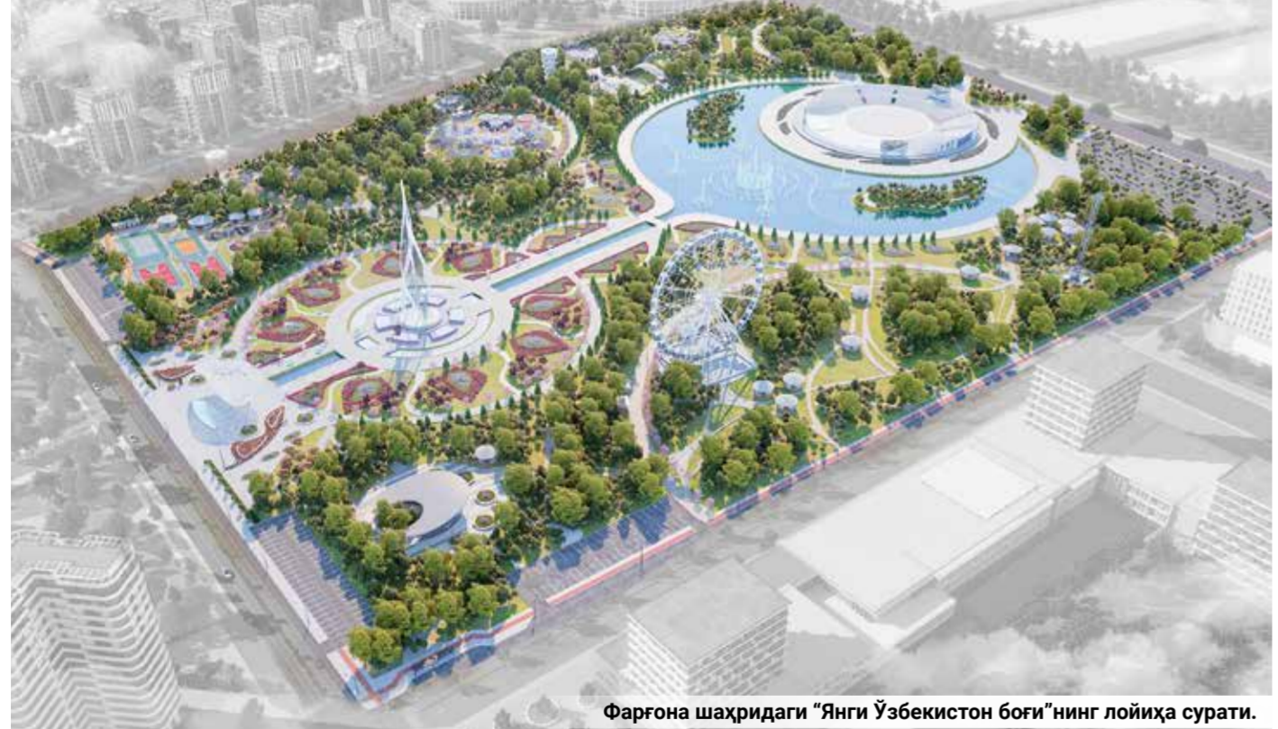
Фаргона шаҳридаги "Янги Ўзбекистон боғи"нинг лойиҳа сурати.

Абдусами ҲАҚБЕРДИЕВ, "O'zbekiston bunyodkori" мухбири.