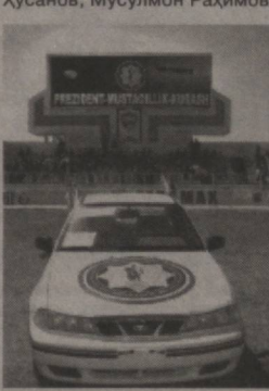
самарқандлик Ўткир Сало-мов, сурхондарёлик Давлат Чориев ва бошқа чапдаст ку-