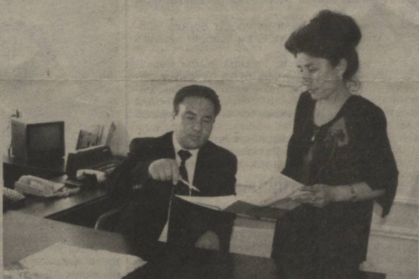
қиядорлик жамиятларини киритиш мумкин.

лик у вилоят бошқармаси бошлиғининг ўринбосари лавозимига қўтарилиди. Бу лавозимларда ҳам ўзининг нималарга қодир эканлигини амалда намойиш этди. Тирришқоқлиги ва илганувчилиги билан раҳбарият ҳамда мижозлар ишончини оқлади. Айни вақтда эса вилоят бошқармаси бошлиғи вазифасида фаолият юритмоқда. Биз бу далилларни бежиз келтирмадик. Гап шундаки, раҳбарга жуда кўп нарсаси боғлиқ. Ҳўш, бугун "Микрокредитбанк"нинг вилоят бошқармасида аҳвол қандай? Йил бошида ҳисоблаганда мижозлар сони яна ортди. Яширишнинг ҳолати йўқ, улар орасида бошқа банклардан ўтиб келаётганлар ҳам учраятти. Бундай ҳамкорлар сонининг аниқ вақтда 5170 тага етганлиги "Микрокредитбанк"ни вилоятдаги йирк молиявий муассасалардан бири, деб ҳисоблаш имконини беради. Бошқарма бундай муваффақиятга мижозлар ишончини оқлаётганлиги, қолаверса, уларни иқтисодий жиҳатдан қўллаб-қувватлаётганлиги туфайли эришмоқда. Кредит қўйилмаларининг миқдори жорий йил 1 апрел ҳолатига 5642483 минг сўмни ташкил этди. Ушбу кўрсаткич 1 январь ҳолатига таққослаганда 532866 минг сўмга ошганлиги кўринади. Банкнинг иқтисодий кўмагидан фойдаланаётган мижозлар орасида турли йўналишда фаолият юритаётган тадбиркор ва ишбилармонлар бор. Улар кредит маблағлари ҳисобига ишлаб чиқаришнинг турфа тармоқларига асос солимоқдалар. Энг муҳими, банк кредити туфайли туманлар ва олис қишлоқларда кўплаб янги иш ўринлари яратилди. Фермер ҳўжаликларини иқтисодий қўллаб-қувватлаб, аграр соҳа ривожига салмоқли ҳисса қўшаётганлигини таъкидлаш ўринли.