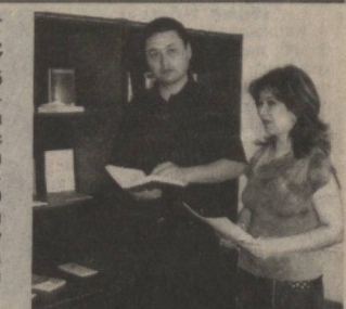
кичик шохобчалар очилиб, фойдаланишга топширилди. Булунгур бўлимига қарашли "Булунгур" ва "Зарафшон", Иштихон бўлими тасарруфидоги "Митан", А.Навий, Азамат номи, "Халқобод", Пайшанба бўлимига қарашли "Тоткент", "Ойбек", "Янгиҳаёт" ва "Қорадарё" миқибанклари аниқ вақтда энг намунали шохобчалар рўйхатида киритиш мумкин. Мавжуд кичик банклар 1364 та фермерга хизмат кўрсатмоқда.

ва мижозлар орасида тобора ортиб бораётганлиги кузатишмоқда. Бу бир вақтлар мавқеига андак пуртур этган Йирк молия муассасасининг яна ўз қаддини дадил тиклаб олаётганлигини билдиради. Марказий банкнинг вилоят Бош бошқармасида ибратли молиявий муассасалар қаторида Халқ банкани ҳам тилга олишганда Самарқандда ҳам ушбу банк фаолияти анча ибратли эканлигини англадик. Молиявий муассаса фаолияти билан яқиндан танишганимизда эса ҳақиқатан ҳам мазкур банк сўнгги вақтларда аҳоли-ва мижозлар эътиборини қозониш унун бир қатор ишларни амалга ошираётганлиги маълум бўлди.