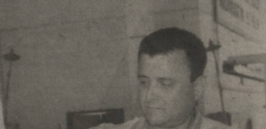
Масалан, Андижон вилояти адлия бошқармаси томонидан «Бўз пахта тозалаш» акциядорлик жамиятининг Бўз туманидаги «Сардорбек» фермер ҳўжалиги 2005 йилда топширилган пахта хомашёсининг 80 фоизлик қийматини тўламаётганлигини аниқлаб қиритган давво аризаси бўйича вилоят ҳўжалик судининг қарори билан фермер ҳўжалигига 1223700 сўм асосий қарз ва 592174 сўм етказилган моддий зарар суммаси ундириб берилди.