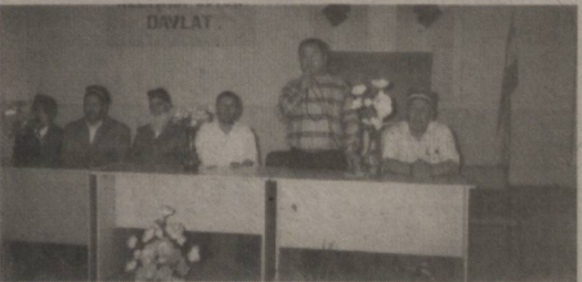
ният қилган қайси ёш бундай замонавий илм масканларида сабоқ олишни истамайди, дейсиз?

Шу ўринда айтиш жоизки, қишлоқ ҳўжалик касб-хунар коллежимиз ҳам ана шундай истиқлол, таълим соҳасидаги ишхотлар мевадидир. Коллежимиз дастлаб касбга йўналтирувчи билим юрти сифатида фаолият бошлаган бўлса-да, илгари фақат бир-икки мутахассислар тайёрларди, ҳолос. Кейинчалик, яъни 2002 йилда қайта реконструкция қилиниб, қишлоқ ҳўжалик касб-хунар коллежи мақо-