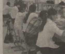
Фойдаланишни тўғри йўлга қўйиш мумкин.

Коллежда 10 йўналиш бўйича 722 ўқувчи тахсил олмақда. Ўқувчиларнинг ўқув режаси ва дастурларда кўзда тутилган касб-хунардан кўчур ағалашлари учун таълим муассасасининг ўқув-моддий базасини жиҳозлаш ва улардан