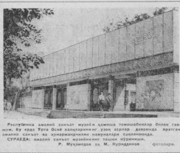
Республика амалий санъат музейи ҳаминша томошабинлар билан га...