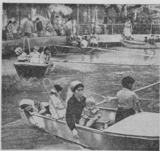
Шахримиздаги Максим Горький номидаги истироҳат боғида меҳнатчиларнинг кунлиги ҳордиқ чиқаришлари учун куйла широнлар яратилган. СУРАТДА: куйла санр.