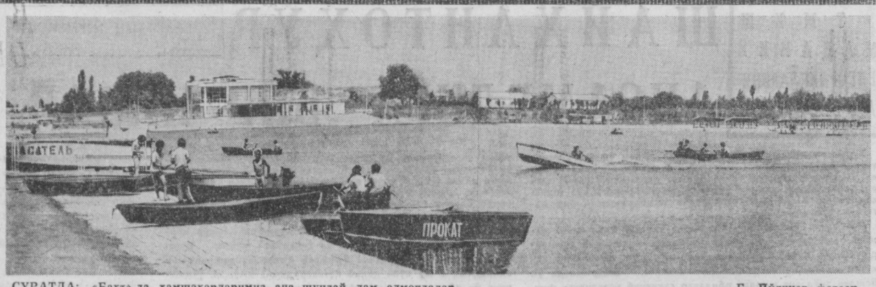
СУРАТДА: «Бахт» да ҳамшаҳарларимиз ана шундай дам олмақдалар.