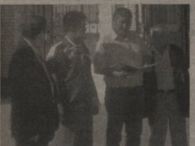
Айни пайтда бир қатор инфратузилмалар, хусусан, мўқобил МТП, ёнилғи-моилаш материаллари, минерал ўғитлар билан таъминлаш шохобчалари, сўвдан фойдаланувчилар уюшмалари, биологаториялар ҳамда банк бўлимлари фермерлар билан ёнма-ён туриб сервис хизмати кўрсатмоқдаки, бу соҳа ривожига катта самара келтирмоқда.

Президентимиз ва республика ҳўкуматининг қишлоқ ҳўжалиги соҳасида иқтисодий ислоҳотларни тобора чуқурлаштириш, фермерликни ривожлантириш, мулкдорлар учун зарур шарт-шароитларни яратиб бериш, ҳўқуқларини муҳофаза қилиш, бир сўз билан айтганда уларни ҳар томонлама қўллаб-қувватлаш бўйича қабул қилинаётган бир қатор ҳўжатлар асосида бу борадаги сўй-ҳаракатлар юртимизда кенг кулоч ёймоқда.