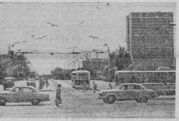
Марказий кўчалардан биринчи. Пиедалар ва транспорт.

Пиедалар ҳуқуқини намунали йўлга қўйиш ҳам аҳдоқан, ҳам юридик нуқтаи-назардан муҳим аҳамиятга эга. Ҳайдовчилар қатори пиедаларга бўлган талабларга қатъий амал қилиш ҳаракат ҳафсизлигини таъминлашда асосий омил бўлиб хизмат қилапти.