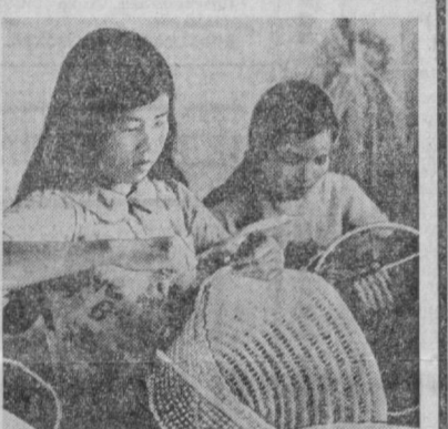
Жанубий Вьетнамда янги маҳаллий тартибдаги саноат норхоналари ташкил этилмоқда.

ПРАГА. Словакиянинг Яеловске-Букувинге шаҳридаги атом электр станцияси қурилишида ишлаш муваффақиятли давом этмоқда. Бу электр станцияси учун машиналарнинг Совет Иттифоқи етказиб бермоқда. Ҳозир қу-