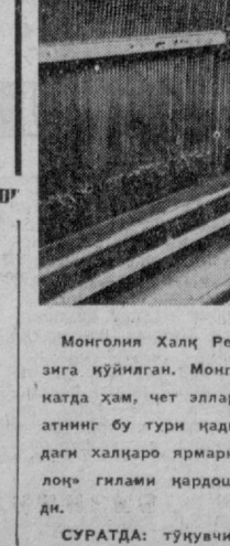
Монголия Халқ Республикасида гилам ишлаб чиқариш саноат негизга қўйилган. Монголия гилам тўқувчиларининг маҳсулотлари мамла-катда ҳам, чет элларда ҳам шуҳрат-қозонган. Манзарали-амалий санъ-атнинг бу тури қадимий аънаваларга эга. Айниқса, Лейпциг ва Брно-даги халқаро ярмаркаларда совирилган билан тақдирланган «Олтин бу-лоқ» гилами қардош социалистик мамлакатларда севиб харид қилина-ди.

Тошкент экскурсия ва саёбатлар бюроси ана шундай дўстлик сафарини ташкил эт-ди.