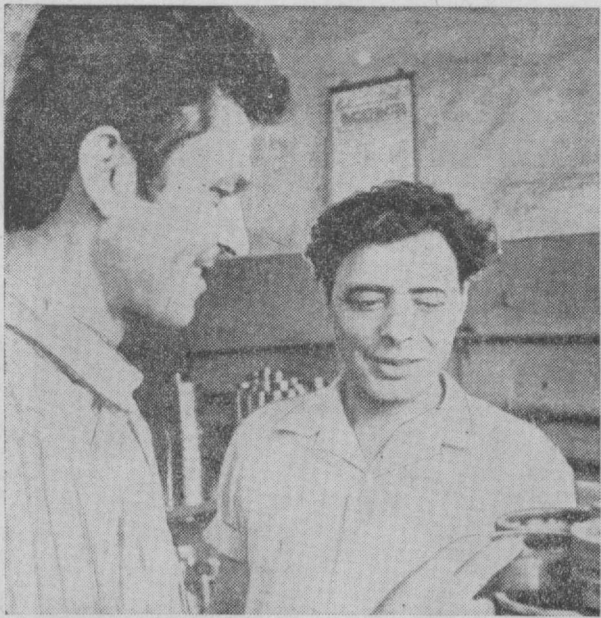
Пойтахт подшпинниклар ремонтни заводда маҳсулот сифатини яхшилаш, меҳнат самардорлигини ошириш ҳамда таннархни намайишри устида катта ишлар олиб боришмоқда. Ана шу тадбирларнинг системали амалга оширилиши натижасида корхона маҳсулотига бўлган талаб тобора ортиб бораётган, меҳнат унумдорлиги ошмоқда.

ЎЗБЕКИСТОН КП ТОШКЕНТ ШАҲАР КОМИТЕТИ ВА ТОШКЕНТ ШАҲАР СОВЕТИНИНГ ОРГАНИ