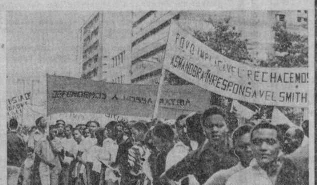
ФРЕЛИМОНинг раҳбарлигида, Африка ҳамада бутун дунё прогрессив кучларининг мадди билан Мозамбик халқининг гонимона кураши натижасида мустақилликка эришган Мозамбик Халқ Республикаси Эм-баббе халқи миллий ооздлик курашидаги, ўз масъулятини яхши ҳис этмоқда.

НЬЮ-ЙОРК. Америка ахборот агентликларининг Монтевидеодан хабар берилганларига кўра, Уругвай президентини Хуан Бордери мамлакатнинг қуролли қучлари томонидан ўз лавозимидан бўшатилади. Республика президентини ўринбосари Алберто Демичели Уругваининг янги президенти сифатида қасамёд қилди.