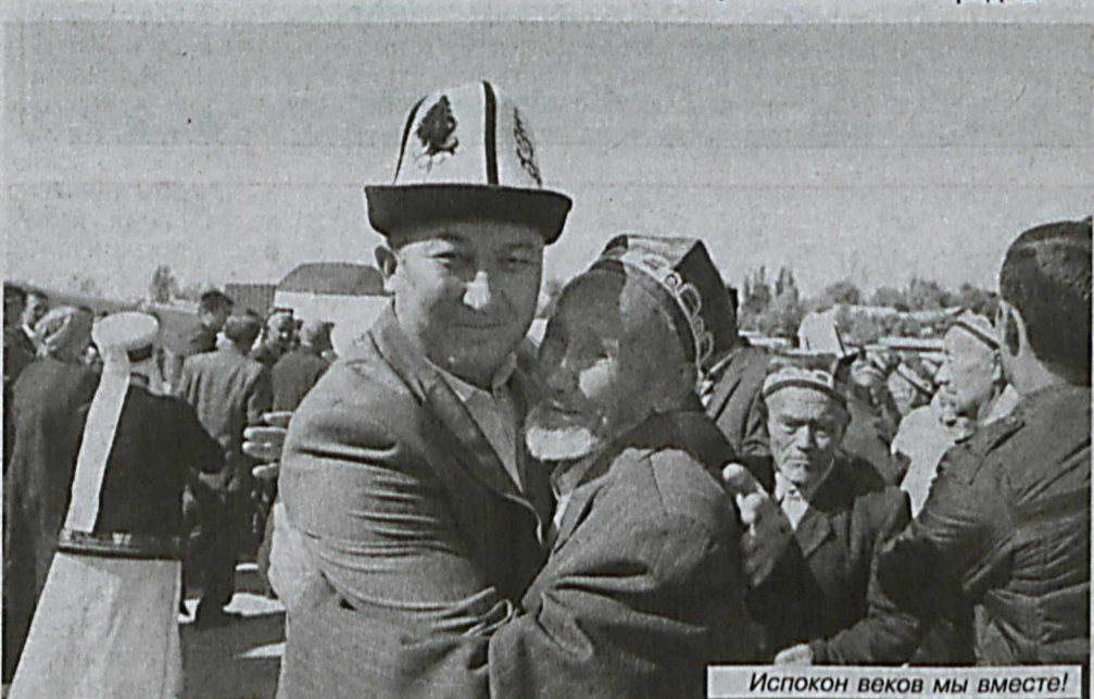
Испокон веков мы вместе!

— Узбекистан занял ведущую геополитическую позицию в Центральной Азии. Открытая внешняя политика Президента Шавката Мирзиёева имеет важное значение в развитии региона.