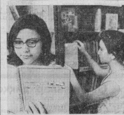
Ленин районидаги Аркадий Гайдар номи болалар кутубхонаси район ўқувчиларига намунали хизмат кўрсатмоқда.

Улкамиз турли-туман ўсимликларига жуда ҳам бой. Тошкент Ботаника боғининг Ф. Н. Русанов бошчилигидаги бир гуруҳ олимлари мунтазам равишда наботот илми билан шуғулланиб, ўсимликлар оламини ҳимоя қилиш, намунаси намайиб қолган қадимий ва маҳаллий ўсимликларни қўлайтириш учун ишлар олиб боришди. Ҳозир бу боғда ноёб ўсимликлар қўлайтиришда муҳим аҳамиятга эга бўлади.