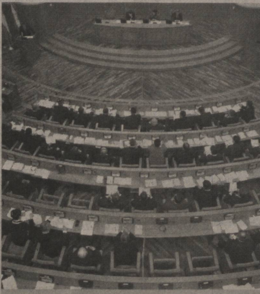
СУРАТЛАРДА: ялпи мажлис ишдан лавҳалар.

Мажлисида Вази́рлар Маҳма́сининг тақлиф этилган аъзолари, фаолияти Сенатнинг ялпи мажлиси кун тартибига киритилган масалаларга дахлдор давлат органларининг раҳбарлари ҳозир бўдилар.