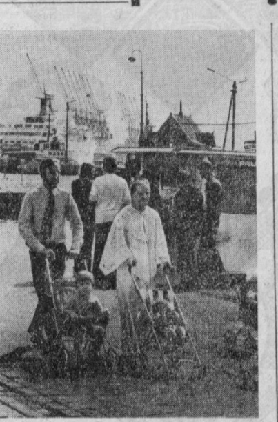
Финляндиянинг пойтахти — Хельсинки. Ден-гиз порти ёнида.

«Козлодуй» би-электр станцияси барно эти-лган янги электр станциялари олди 1980 йилга бориб электр қуввати ҳисоб-қисми 37 процент кў-бат-соатга етказиш-вазифани қўйди. Соци-лист мамлакатлар билан самарали ҳам-корлик ва биринчи навбатда Совет Итти-фоқининг ҳазилсиз ёр-дамга туғайли Болга-риянинг энергетика ба-засини ривожланти-ришда мана шундай муваффақиятларга э-ришилди.