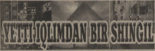
YETTI-YOLIMDAN BIR SHINGIL