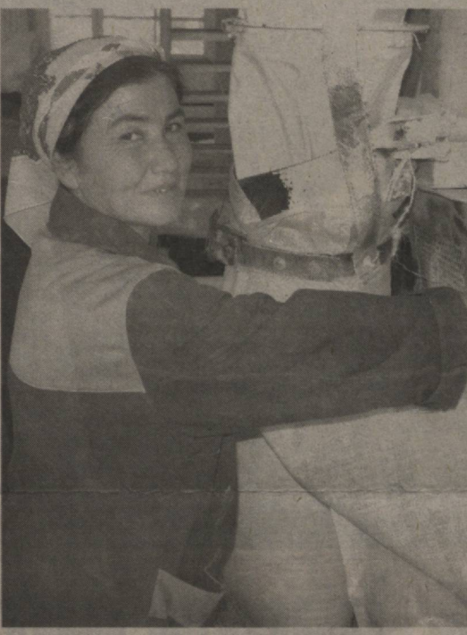
«Башорат қилиш осон эмас»

Тиллога бергисиз еримиз, иқлимимиз бор. Ер-сув ўзимизники, Ватан ўзимизники. Бизга барча имконият берилган, барча йўллар очик. Озроқ қуюнчақлик бўлса бас... Вақт келарки, Махшад бозорини Паркентнинг узуми, Париж супермаркетларини Қуванинг анори, Пекин ярмаркаларини Сирдарёнинг қовуни босиб кетар. Ушандай кунларни, иншооллох кўрармиз.