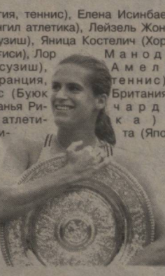
Арденн (Бельгия, теннис), Елена Исинбаева (Россия, енгил атлетика), Лейзель Жонс (Австралия, сузши), Яница Костелич (Хорватия, тоғ чанғиси), Лор Маноу (Франция, сузши), Амели Моресмо (Франция, теннис), Зара Филипс (Буюк Британия, от спорти), Санья Ричардс (АҚШ, енгил атлетика), Йоши Такешина (Япония, волейбол), Бет Твидл (Буюк Британия, спорт гимнастикаси), Кси Ксиньфань (Хитой, волейбол).

Халқаро спорт матбуотлари уюшмаси (AIPS) "Йилнинг энг яхши эркек спортчиси", "Йилнинг энг яхши аёл спортчиси", "Йилнинг энг яхши жамоаси" ва "Матбуот ишлари учун энг яхши шариоит" йўналишлари бўйича даявогарлар номини эълон қилди. "Без спортнинг хабар беришича, номзодлар орасида ўзбекистонлик бир нафар спортчи ҳам бор. У эркин кураш бўйича Сидней Олимпиадаси кумуш медали соҳибига, Афина Олимпиадаси қолиби, икки карра жаҳон ва кўп карра Осиё чемпиони ҳамда XV қитъа ўйинлари олтин медали эгаси Артур Таймазовдир. 2006 йилнинг "Энг яхши спортчиси" номини кўлга киритиш учун унга яна 18 спортчи рақиблик қилмоқда. Улар — Фернандо Алонсо (Испания, "Формула-1"), Уле-Айнар Бьорндален (Норвегия, биатлон), Жанлуиджи Буфон (Италия, футбол), Жо Кальзаге (Буюк Британия, бокс), Фабио Каннаваро (Италия, футбол), Тим Дон (Буюк Британия, триатлон), Мариан Драгулеску (Руминия, спорт гимнастикаси), Роже Федерер (Швейцария, теннис), Жилберто Жива (Бразилия, волейбол), Ник Хайден (АҚШ, мотоспорт), Александр Овечкин (Россия, хоккей), Асафа Пауэлл (Ямайка, енгил атлетика), Бенжамин Райх (Австрия, тоғ чанғиси), Роналдиньо (Бразилия, футбол), Валентин Росо (Италия, мотоспорт), Михаэл Шумахер (Германия, "Формула-1"), Тайгер Вудс (АҚШ, голф), Зайниддин Зидан (Франция, футбол). "Йилнинг энг яхши аёл спортчиси" йўналишига эса куйидаги спортчи номинлар даявогарлик қилишмоқда: Чикари Ичо (Япония, эркин кураш), Николь Кук (Буюк Британия, велоспорт), Жюстин Энен-