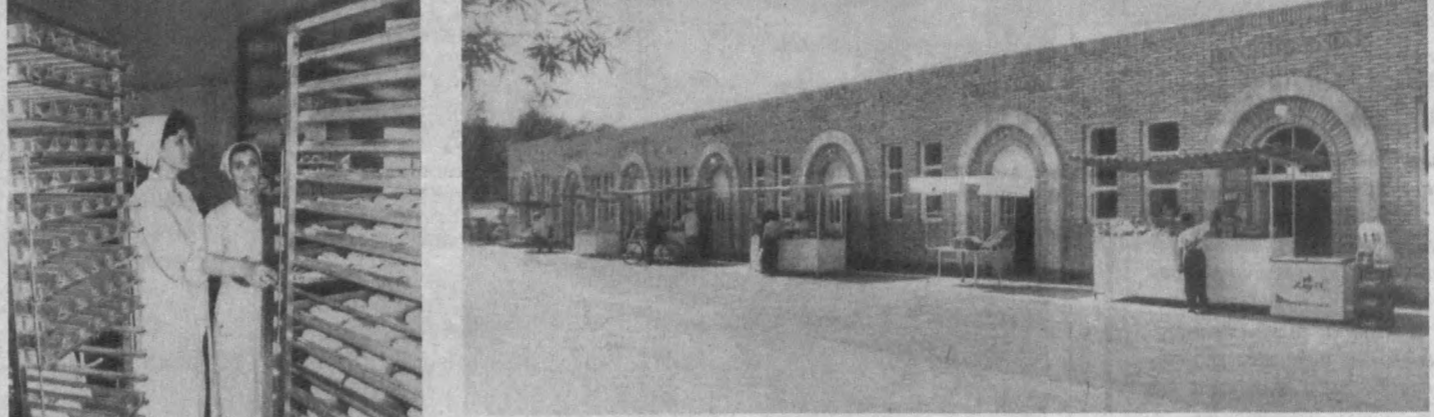
Кўқон нон комбинати қошида «Миллий нон» деб номланган янги завод иш бошлади. У «Винклер», «Рус печи», «Экмасан» сингари энг замонавий асбоб-ускуналар билан жиҳозланган. Ҳозир бу ерда кунига 20 тонна нон маҳсулотлари ишлаб чиқарилмоқда.