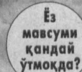
Ёз мавсуми қандай ўтмоқда?

«Оҳангарон» ҳиссадорлик жамияти галлакорларининг бугунги шижоатлари улкан хирмондан дарак бераётгандай.