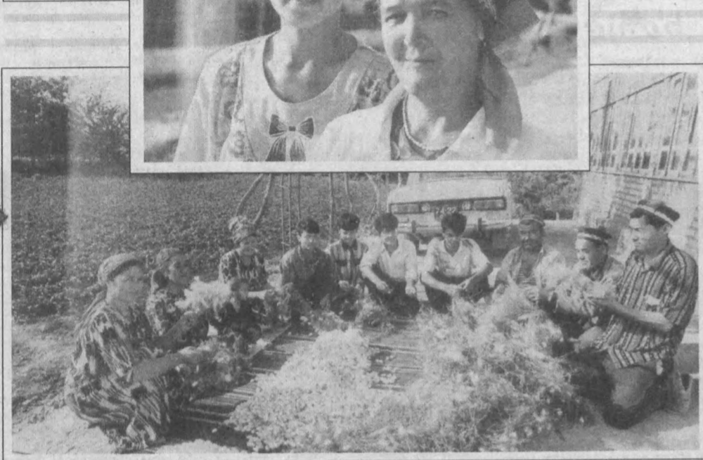
Бугун Нарпай тумани далаларининг фаизи, шуқуҳи узгача. Эл ризқ-насибасини яратадиган, дастурхон тўқинлигини таъминлайдиган соҳибқору чорвадорнинг, пиллақору пахтакорнинг кунлида бир ёруғлик - яратувчанлик иштиғи бор. Туманининг қайси ҳўжалиғига бошманг, ерда ризқ ундираётган деҳқонни учратасиз.